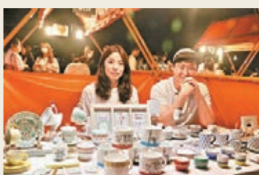
店主指燒酒杯和大象杯最受歡迎。

地址：首爾市汝矣島漢江公園水光廣場 開放時間：3月-10月 每周五和周六，6pm-11pm 網址：www.bamdokkaebi.org