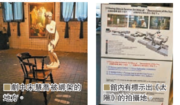
劇中宋慧喬被綁架的地方。

據知，樓高4層的三炭藝術中心除了劃分為多個不同主題的展館外，亦設有客房可供住宿，連宋仲基等主演也曾在此留宿，負責人也特別把該房間變成景點展出。此外，在三炭藝術中心旁邊的Rail By博物館不但曾作為《太陽》劇中發電廠的內部場景，韓劇《幽靈》、人氣綜藝節目《Running Man》也曾在此取景。礦場內還設有咖啡廳和餐廳，逛畢後感疲累，亦不怕沒有地方休息醫肚。