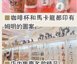
店內售賣多款精品。