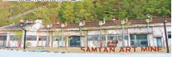
三炭藝術礦場幅員遼闊。