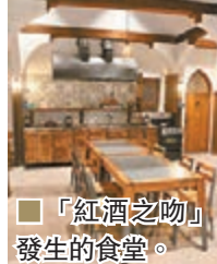
「紅酒之吻」發生的食堂。

除了江原道外，位於首爾東大門的Doota 免稅店，剛於上月20日開幕，不但由宋仲基做代言人，甚至在D3層舉行了一個《太陽的後裔》特別展覽，裡面除了擺放了3張巨型海報，以及多個宋仲基人型紙板外，最特別是還原了劇中烏魯克軍營的食堂和宋慧喬的房間，劇中有名的「紅酒之吻」、宋仲基和宋慧喬的談情位都是在這些場景中發生，粉絲可置身其中，幻想自己成為宋慧喬，與宋仲基談情。因該展覽開放至凌晨2時，大家可以飽飲宵夜後才來參觀。