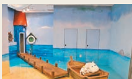
位於地下一樓的體驗館。

而全球最大的姆明Cafe在上月20日於韓國新沙洞隆重開幕，樓高3層，地舖主要售賣多種姆明精品，店員表示，鐘、書籤、磁石等最受歡迎。一樓則是咖啡廳，座位上放了數個姆明公仔，方便客人合照，但食物方面暫時就只得馬龍、之後將會加入班戟和蛋包飯等簡單輕食。地下一樓的體驗館可謂攝影專區，全層劃分為數個主題，放置多個姆明公仔、模型，顧客可選擇心水主題與姆明合影。