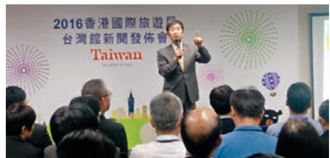
台灣觀光局駐香港辦事處主任巫宗霖講解台灣旅遊各項優惠。