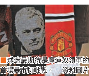
球迷最期待是摩連奴領軍的首場曼市打吡戰。

英超聯昨公佈了2016/17球季賽程, 首輪即演阿仙奴主場鬥利物浦的大戰, 利物浦第3及4輪還要連續作客熱刺及主場對衛冕的李斯特城, 英國時間9月10日的第4輪更將爆發摩連奴執教曼聯及哥迪奧拿接手曼城後於奧脫福上演的首場曼市打吡。