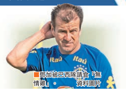
鄧加被巴西隊請食「無情雞」。

阿根廷昨在先收起美斯下憑拉美拿、拿維斯和域陀古斯達入波輕取玻利維亞3:0, 是2007年後首支美洲盃小組三全勝之師, 8強會鬥委內瑞拉, 同於D組的衛冕冠軍智利贏巴拿馬4:2晉級, 會跟墨西哥爭入4強。明早8強開戰, 先輪後兩連勝的主隊美國撼厄瓜多爾(now 650 台周五9:30a.m.直播), 右閘耶迪連停賽, 一