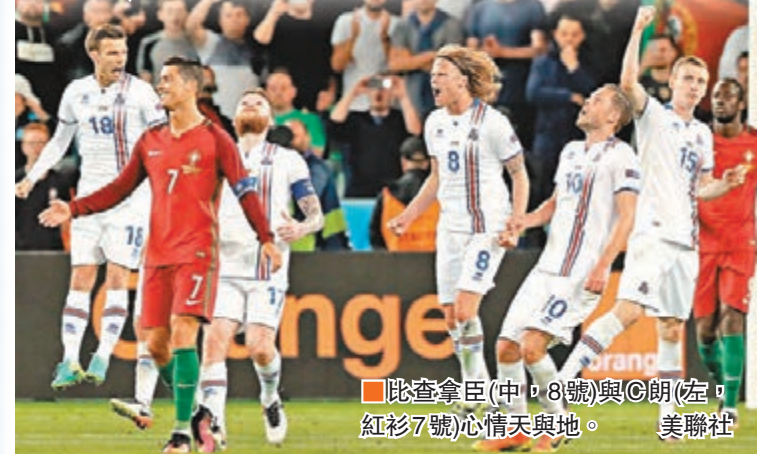
比查拿臣(中, 8號)與C朗(左, 紅衫7號)心情天與地。