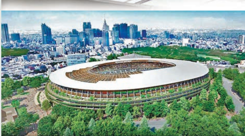
舛添原希望避免損害東京奧運形象，推遲表決動議。圖為奧運主場館設計圖。網上圖片