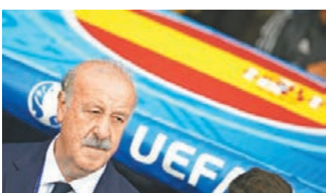
西班牙主帥迪保斯基。