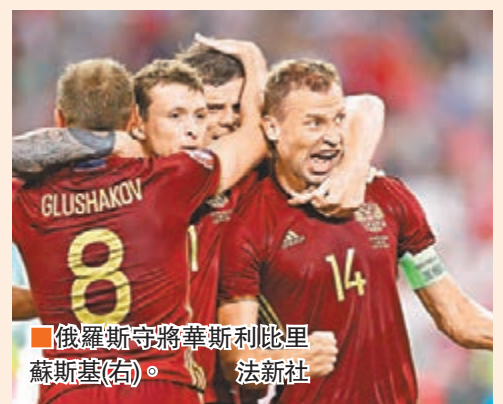
俄羅斯守將華斯利比里斯基(右)。