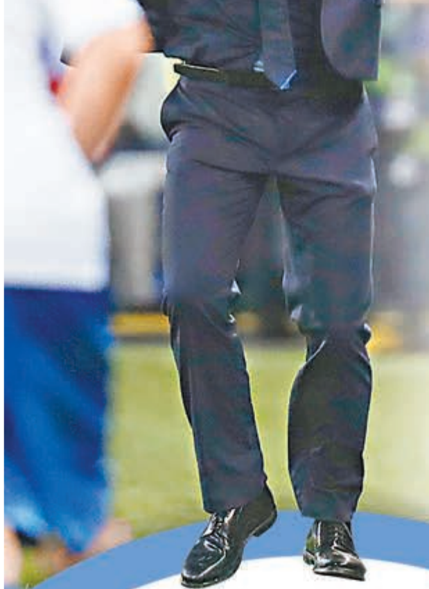
干地場邊激動指揮。