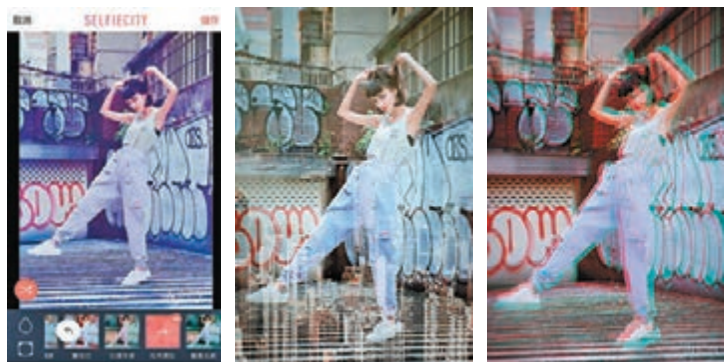
■ 介面 ■ 「太平山下」效果 ■ 「蘭桂坊」效果

一個好的濾鏡不只是靠單調較照片色調，而「SelfieCity 潮自拍」主打城市特色濾鏡會結合濾鏡及修顏功能於一身，簡單易用，讓各位 Selfie 新手只需 1 秒即可調出質感照。其主打特效濾鏡的「SelfieCity 潮自拍」更以世界各地不同城市為題，除今次大推的香港，當中亦已收錄紐約、東京、巴黎、荷里活、台灣等濾鏡，讓用家在彈指之間一秒切换不同城市風情，備受各地「自拍控」熱愛，一秒遊走世界角落。它以城市濾鏡為主要特色，就是要讓大家不用出