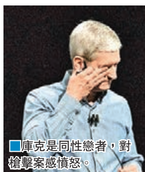
庫克是同性戀者，對槍擊案感憤怒。

蘋果公司總裁庫克前日主持全球開發者大會時，特別要求出席者為槍擊案遇難者默哀。本身是同性戀者的庫克，更忍不住流淚，並形容槍擊案是「愚蠢、無良、充滿憎恨的恐怖主義行為」。庫克於前年「出櫃」，並推動蘋果內部多元文化，他亦一直致力為LGBT社群爭取權益，今年3月便曾與其他科技界領袖聯署，反對南卡羅來納州一項打壓LGBT的法例。