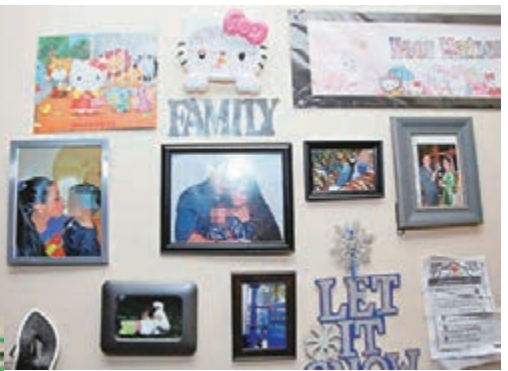
馬丁家中牆壁貼上家人照片。網上圖片