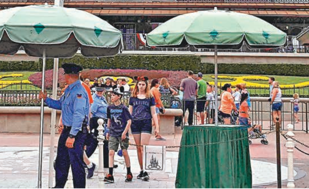
奧蘭多迪士尼樂園已加強保安，增加偵測器、警犬和執法人員。路透社