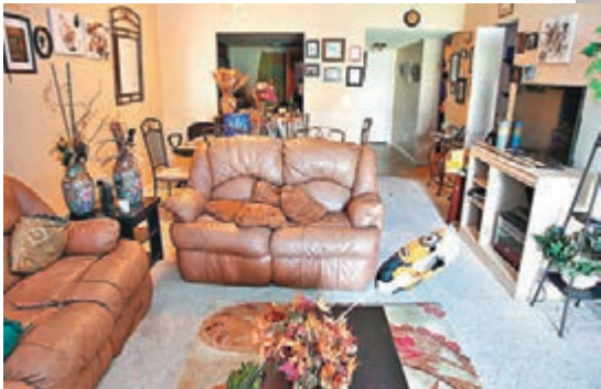
英媒走訪槍手屋企拍照。網上圖片