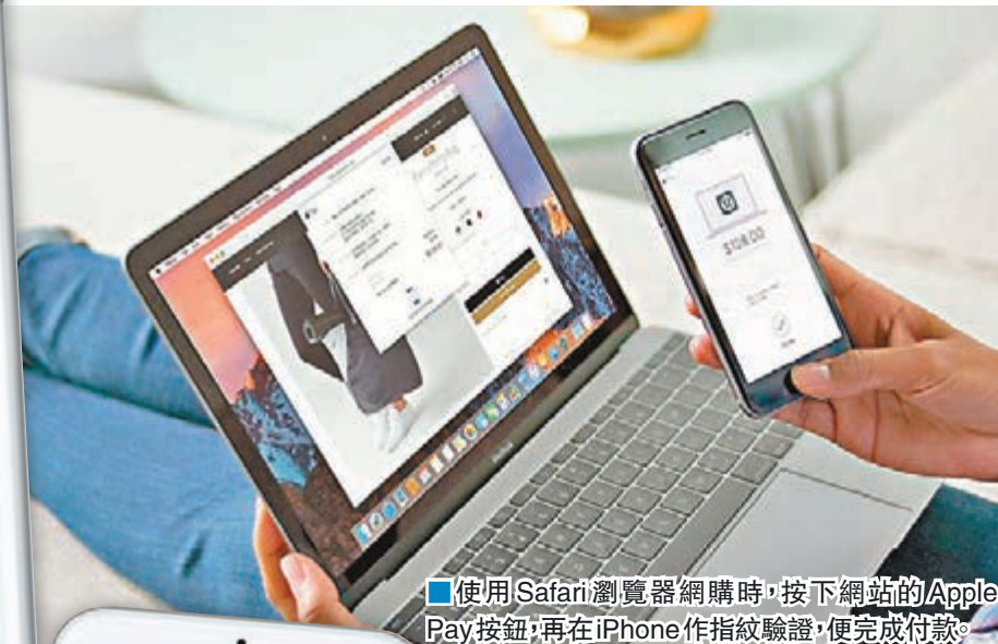
■使用Safari瀏覽器網購時，按下網站的Apple Pay按鈕，再在iPhone作指紋驗證，便完成付款。