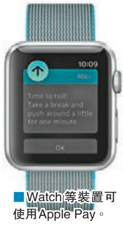
■Watch 等裝置可使用 Apple Pay。

有本港資訊科技界人士表示，手機使用的移動支付模式於內地已非常普遍，Apple Pay 登陸將為香港用家帶來新的消費方式，亦能令香港趕上內地經濟步伐。他又指，移動支付模式可能取代實體信用卡，因信用卡早已於用家消費前登記在手機中，用家無需再隨身攜帶，減少遺失後被盜用的可能，不過使用移動支付模式，有機會增加被盜用網上個人資料的危險。香港資訊科技商會榮譽會長方保倫亦提醒，移動支付模式設於個人手機中，用家為免手機遺失後被挪用電子服務，需設置手機密碼。