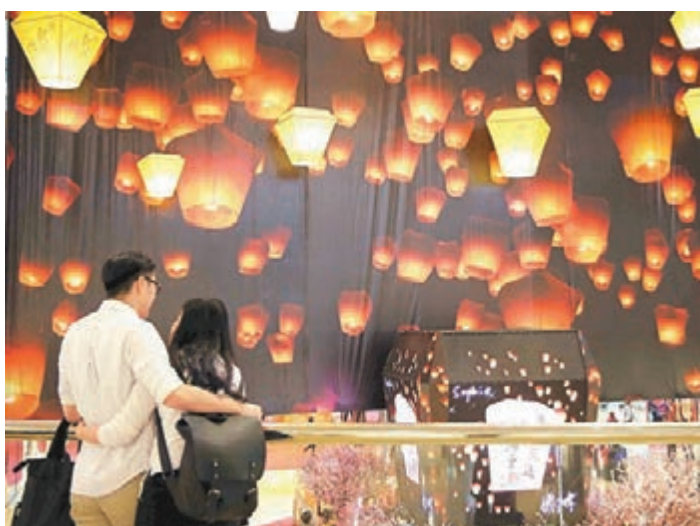
■有調查指44%人不相信婚姻是一生一世的承諾。