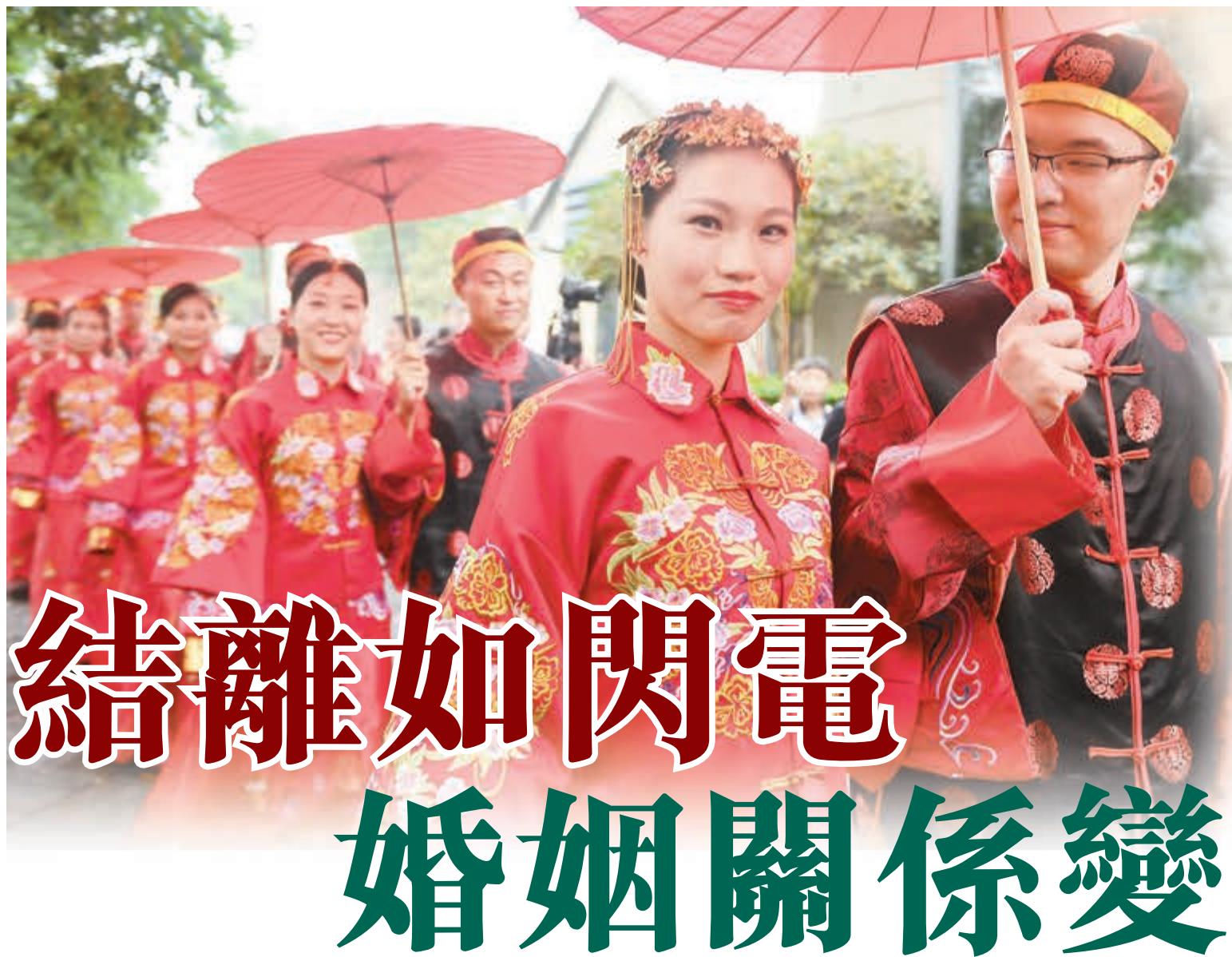
■現今婚姻觀念正在改變。圖為新人舉行傳統婚禮。資料圖片