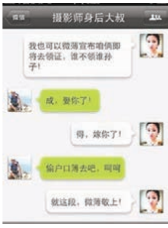
■有男女認識5天後即「閃婚」。資料圖片

當今女性不一定如往昔般着重或憧憬結婚，也可能婚姻觀念趨向薄弱，而獨身主義則趨向愈為社會所接受。