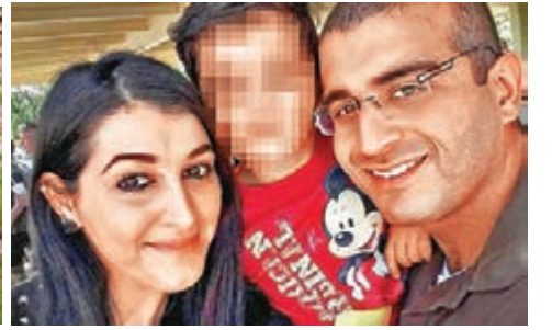
馬丁與現任妻子及兒子。網上圖片