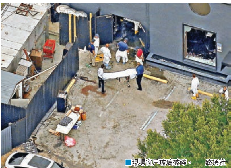
現場窗戶玻璃破碎。路透社

■《紐約時報》/《紐約每日新聞》/美聯社/路透社/法新社/《洛杉磯時報》/《華盛頓郵報》