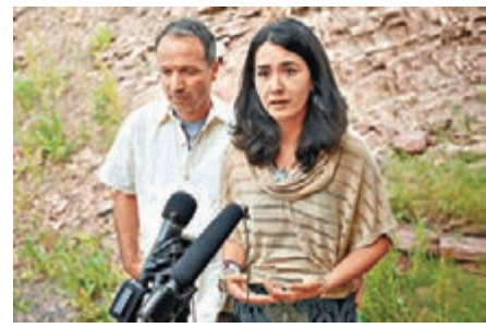
前妻曾多次被馬丁虐打。