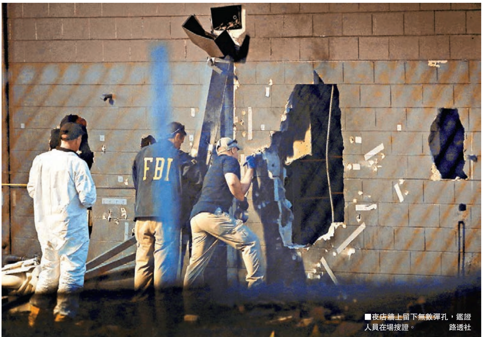
夜店牆上留下無數彈孔，鑑證人員在場搜證。