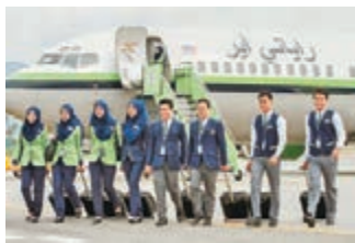
馬來西亞首間遵從伊斯蘭教教義的航空公司「清真航空」(Rayani Air)因違反安全標準，昨日遭監管當局吊銷營運牌照，開業僅半年便「壽終正寢」。

去年12月成立的清真航空，多次被政府及乘客投訴航班延誤，甚至在最後一刻取消航班。大馬民航局4月以違反航空監管條例為由展開調查，並下令公司暫時停運。清真航空其後爆出欠薪及罷工風波，形象進一步受損。