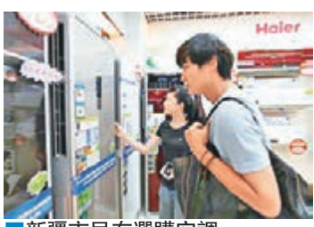
新疆市民在選購空調。

新疆氣象局日前發佈高溫橙色預警，預計從昨日白天開始至明日，南疆盆地大部、吐(魯番)鄯(善)托(克遜)盆地和博州東部等部分地區的最高氣溫將升至37°C以上，這是繼6月3日後新疆氣象局今年發佈第二次高溫橙色預警，全疆大部分地區「高燒不退」。其中素有「火洲」之稱的吐魯番市連續6天氣溫突破40°C，最高氣溫出現在高昌區艾丁湖鄉，達到45.6°C。