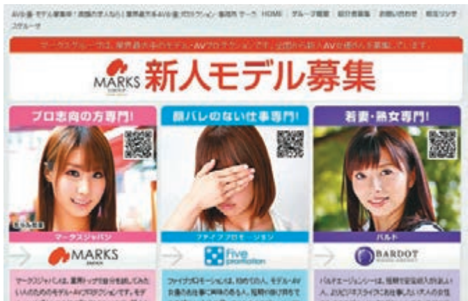
Marks Japan網頁上，列明招募AV女優及寫真模特兒。網上圖片