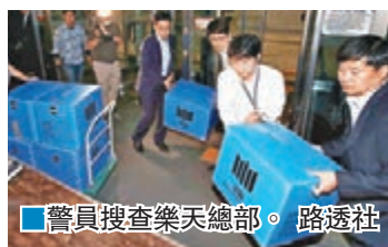
警員搜查樂天總部。

韓國樂天集團昨日宣佈，由於創辦人家族涉嫌挪用公款的調查擴大，因此決定取消原定于7月上市集資4.6萬億韓圓(約302億港元)的計劃。