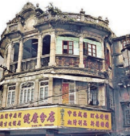
汕頭老城內佈滿百年騎樓，街狀成蛛網分佈。

汕頭此番為強化城市的文明管理，下決心保護古城區的歷史建築風貌，拆除臨時集貿早市，疏通巷道「斷頭路」，不僅獲得當地民眾及商販的雙重認可，好消息傳到外地鄉親耳中時，不少人在其社交圈紛紛點讚。據悉，當地政府為了順利引導商販遷至附近市場經營，實行三個月免租。