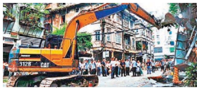
汕頭拆臨時集市，百座百年騎樓重見天日。本報廣州傳真

隨着新區建設熱火朝天，現代化購物城入駐，廣東汕頭老城內安平路、海平路上的兩個臨時集市近日被一併拆除。過去，汕頭開埠逾100座百年騎樓因其髒亂差管理而湮沒在市井嘈雜中，呈頹敗之相，如今它們終於重見天日，重現城市光鮮亮麗。對於此次拆卸，當地民眾拍手稱快，直喊「拆得好」。