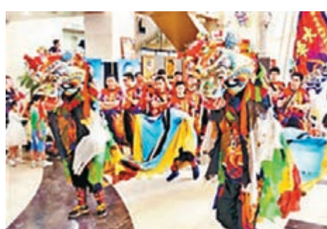
深圳舞麒麟展「非遺」。網上圖片

為響應中國第十一個「文化遺產日」，以「讓文化遺產融入現代生活」為主題的中國文化遺產系列展示活動日前在深圳福田中心書城北廣場舉行。系列展示活動採用圖文、實物展示內地包括福田區的非物質文化遺產項目，如道家龍門派(嗣廣)點穴牽頓脊柱整復術等傳統中醫推拿法、手工藝品上梅林圍裙帶、傳統藥業項目不孕不育中醫療法，均一一亮相。