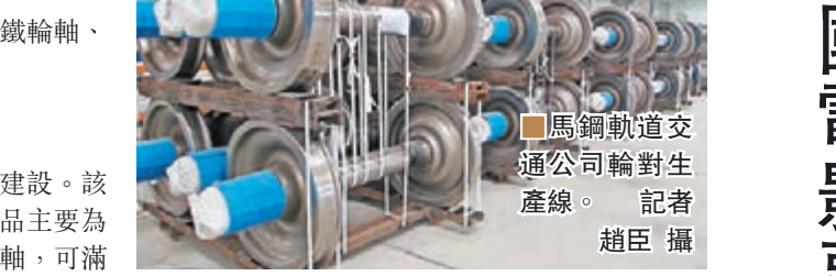
馬鋼軌道交通公司輪軸生產線。記者 趙臣 攝