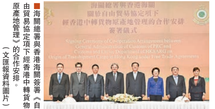
由海關總署與香港海關簽署《自由貿易協定項下經香港中轉貨物原產地管理》的合作安排。