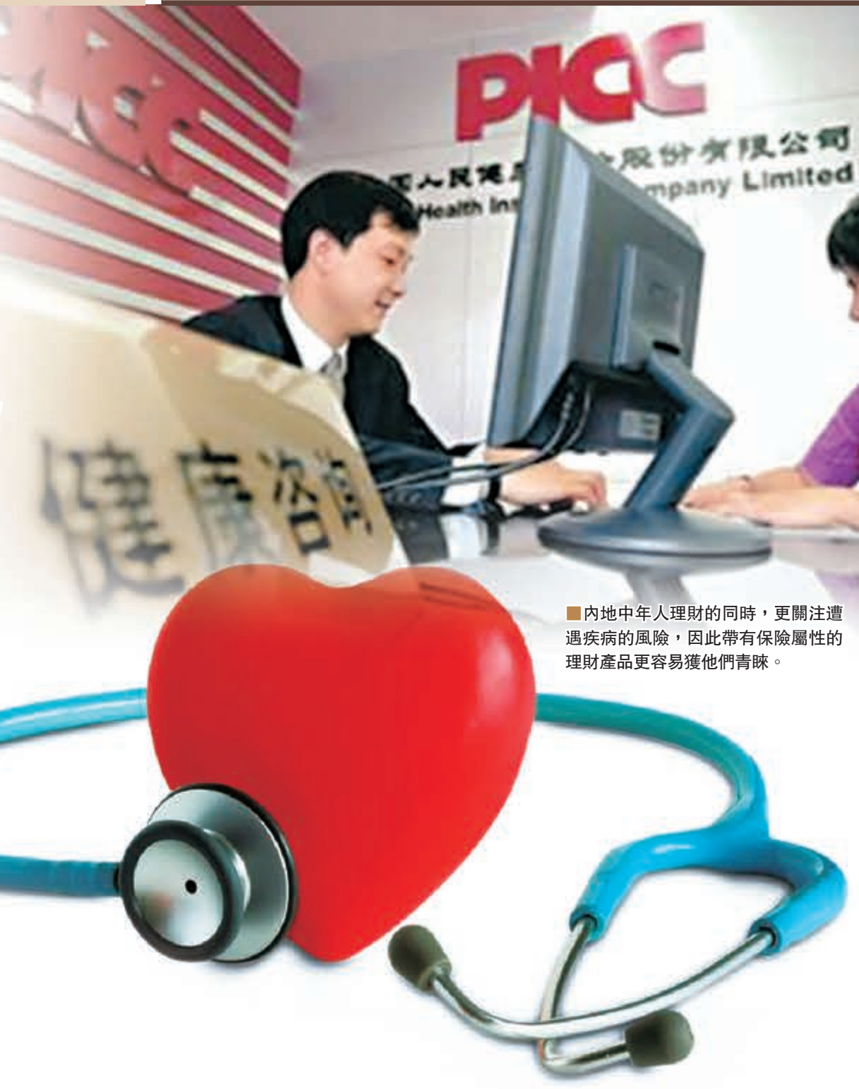
■內地中年人理財的同時，更關注遭遇疾病的風險，因此帶有保險屬性的理財產品更容易獲他們青睞。