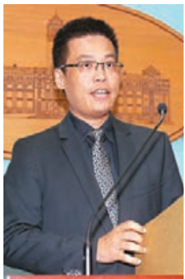
蔡英文辦公室發言人黃重謨。