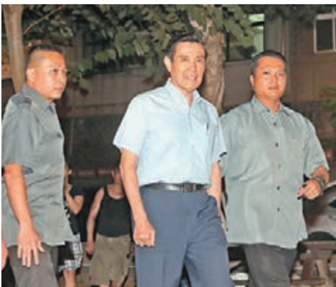
馬英九早前申請於15日應邀赴香港出席「亞洲卓越新聞獎頒獎典禮」。 資料圖片

香港文匯報訊 綜合報道,蔡英文辦公室昨日駁回馬英九赴香港演講的申請案,並提出4點理由,包括馬英九經管或接觸的機密甚鉅,而且卸任不到1個月,相關機密仍具高度保密的必要。馬英九辦公室昨天回應稱,台灣當局似已假定馬英九洩密機會甚大,極不尊重卸任台灣領導人,也是對台灣民主的諷刺,