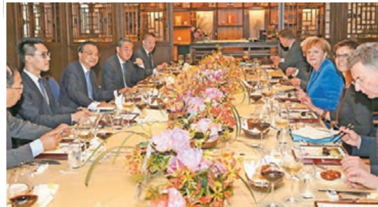
李克強與默克爾在頤和園結束散步後,在一處朱門灰瓦的園林建築內小範圍會談並共進晚餐。

伴着湖光晚霞,李克強與默克爾昨日在頤和園結束散步後,在一處朱門灰瓦的園林建築內小範圍會談並共進晚餐。李克強表示,當前中德關係在高水平上持續向前發展。第三輪中德政府磋商制訂的《中德合作行動綱要》得到穩步落實,兩國各領域合作不斷取得新進展。中方對中德關係與合作的未來充滿信心。