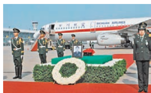
申亮亮骨灰抵達新鄭機場。

記者了解到,隨申亮亮的骨灰盒一起被帶來的還有他簡單的遺物。在遺物中,除了申亮亮生前所穿過的幾套軍裝外,還有一封革命烈士通知書,以及4枚申亮亮犧牲後所獲得的勳章:聯合國維和勳章、馬里戰十字勳章、中國人民解放軍和平使命紀念章、中國人民解放軍獻身國防金