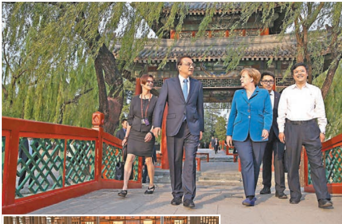
昨日,中國國務院總理李克強陪同來華訪問的德國總理默克爾在頤和園散步。

香港文匯報訊(記者田雯、通訊員齊琦及綜合報道)應中國國務院總理李克強邀請,德國總理默克爾於昨日(12日)至14日對中國進行正式訪問。這是默克爾在其任內的第九次訪華。為期三天的訪問期間,李克強與默克爾將共同主持第四輪中德政府磋商。昨日,默克爾應李克強之邀在頤和園進行晚餐,李克強說,願深入探討「中國製造2025」與德國「工業4.0」對接。同日,默克爾還接受了南京大學授予其名譽博士學位。