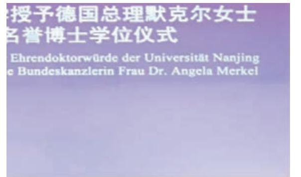
昨日,南京大學校長陳駿(台上左三)向默克爾授予名譽博士學位。

默克爾對南京大學授予她名譽博士學位表示衷心的謝意,並向南京大學全體師生致以問候。她對2007年拜訪南京大學記憶猶新。默克爾表示,名譽博士稱號是對雙方已有的友好關係的肯定,也是中德兩國間友好關係的體現,更是對今後加深關係、充滿信心的一個信號。