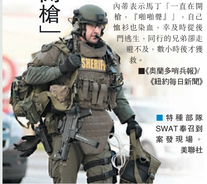
特種部隊SWAT奉召到案發現場。