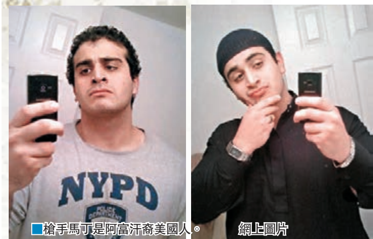
槍手馬丁是阿富汗裔美國人。