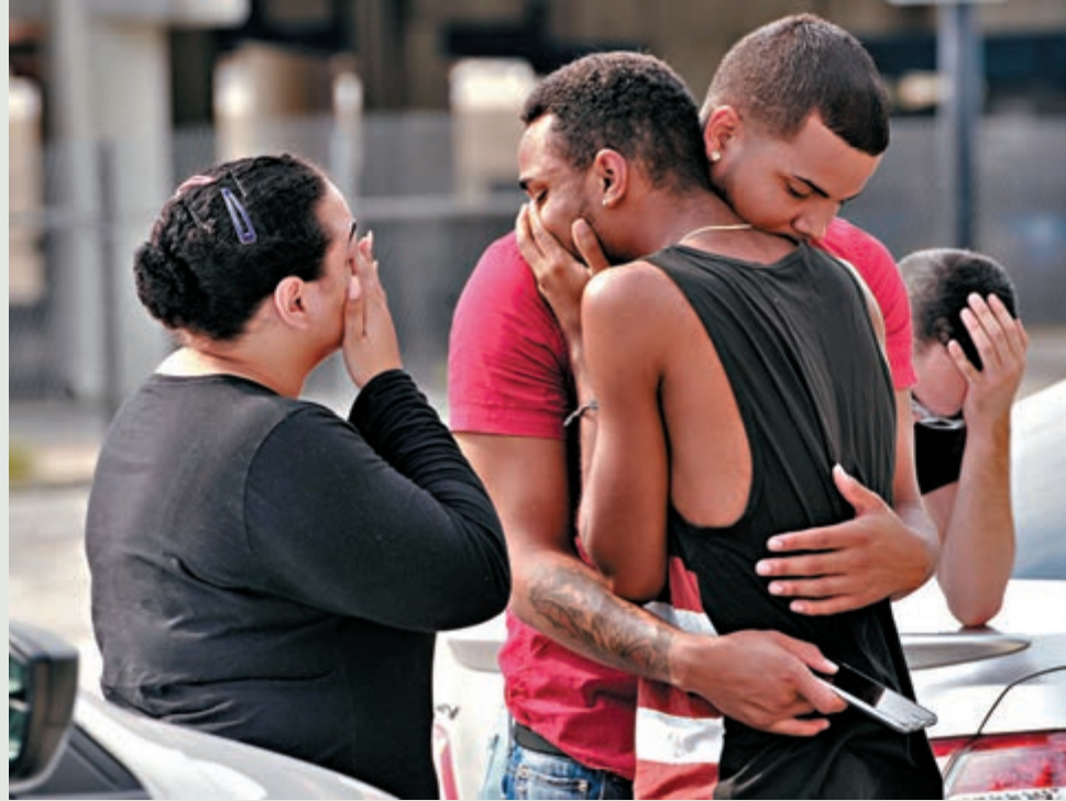
死傷者家屬在醫院外互相安慰。