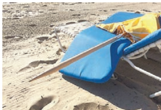
插中貝爾克胸口的兇器。