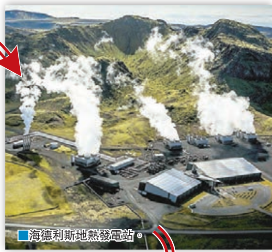
海德利斯地熱發電站。