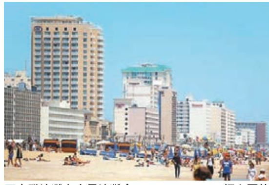
事發沙灘有大量沙灘傘。網上圖片