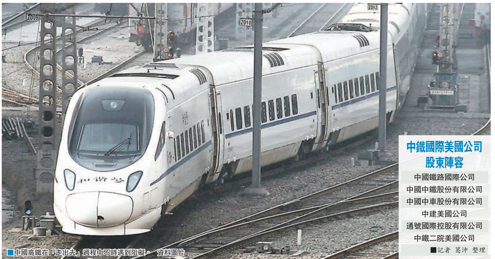
中國高鐵在「走出去」過程中不時遇到阻礙。

香港文匯報訊(記者 葛沖 北京報道)中國高鐵進入美國市場出現波折。北京時間9日晚間,美國西部快線公司在其官網發佈公告,稱正式終止與中國鐵路國際(美國)有限公司為建造美國高速客運鐵路而組建合資公司的一切活動,原因是美政府規定高速列車須在美國製造。中國鐵路總公司有關負責人10日就此回應稱,美國西部快線公司違反與中國鐵路國際公司美國公司簽訂的有關協議,單方發佈終止項目合作的消息,這一行為是錯誤的,不負責任的,我們表示反對,並已依法進行交涉。