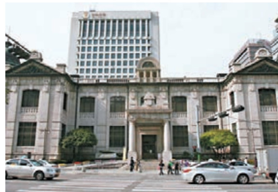
儘管韓國央行意外降息，投資者仍然拋售美元買入近期表現略遜的韓國。圖為該國央行韓國銀行門口。資料圖片

倫周一對美國經濟前景的評估總體樂觀，稱將會加息，但對何時行動三緘其口，部分投資者認為後者更有深意。同時，美國公佈上月非農就業崗位僅增加3.8萬個，為逾五年半來最少，美元即告下滑。投資者拋售美元買入近期表現略遜的韓國，儘管韓國央行意外降息，但韓國/美元匯空押注縮小。韓國央行周四祭出意外之舉，將政策利率降至1.25%的紀錄低點。