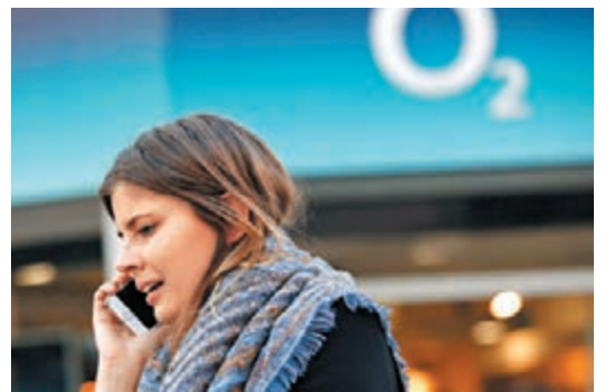
分析指非能源業高收益債，違約風險相對低，適合長期投資。資料圖片

低檔，仍不足以支撐油礦業公司之經營成本，預料後續仍會出現能源及礦業高收益債券違約事件發生。反觀基本面較佳，且信用評級較高的BB-B級高收益債券，例如通訊服務業、醫療業與零售業發行之高收益債券財務體質較佳，違約風險相對低，適合長期投資。