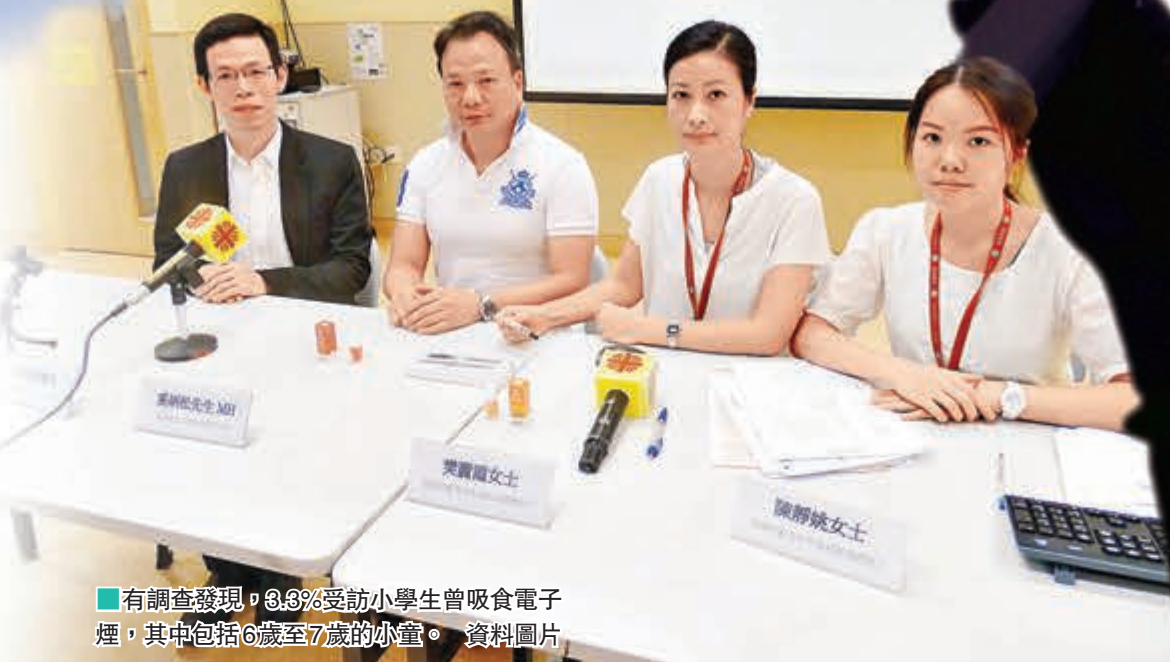
■ 有調查發現，3.3%受訪小學生曾吸食電子煙，其中包括6歲至7歲的小童。 資料圖片