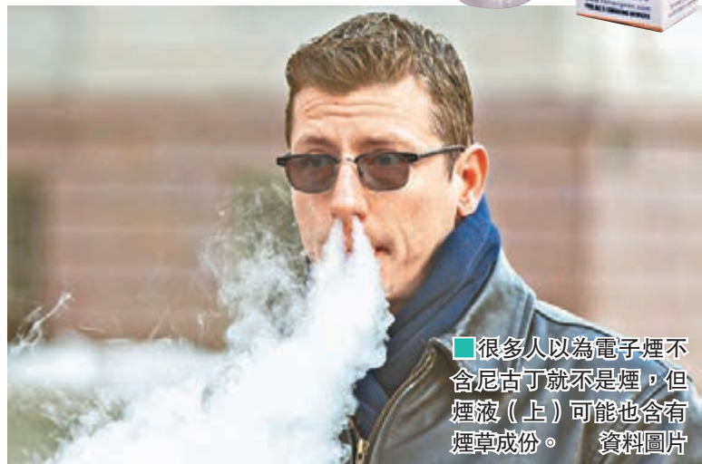
■ 很多人以為電子煙不含尼古丁就不是煙，但煙液(上)可能也含有煙草成份。 資料圖片