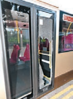
■ 出事巴士落車門其中一扇玻璃爆裂。

香港文匯報訊(記者 杜法祖) 市區又再發生乘客撞爆巴士車門玻璃意外。一名外籍少女昨日清晨乘坐通宵巴士，抵觀塘游泳池對開離座等候落車，巴士轉大彎理站之際，少女疑突然失重心整個人撞向落車門，當場撞爆玻璃。她頭和手被碎片割傷，幸沒被拋出車外，傷勢無大礙清醒送院。這次已是今年第三宗乘客撞爆落車門玻璃事件。