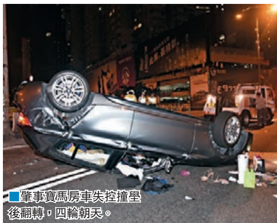
■ 肇事寶馬房車失控撞壁後翻轉，四輪朝天。