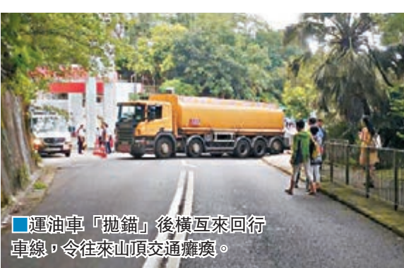
■ 運油車「拋錨」後橫互來回車線，令往來山頂交通癱瘓。

瘓，部分山頂遊客及居民要步行上落山。昨日適逢公眾假期，遊客眾多，上山方向一度出現長達1.5公里車龍，龍尾遠及馬己仙峽道，警方到場協助指揮交通。等候山頂纜車遊人亦大排長龍。