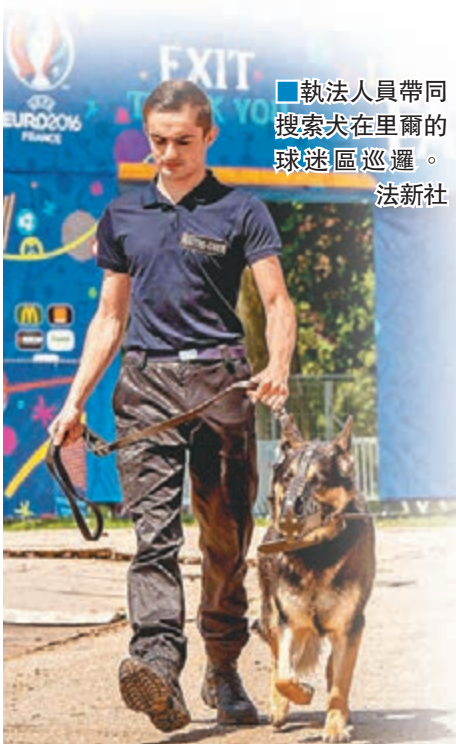
■執法人員帶同搜索犬在里爾的球迷區巡邏。