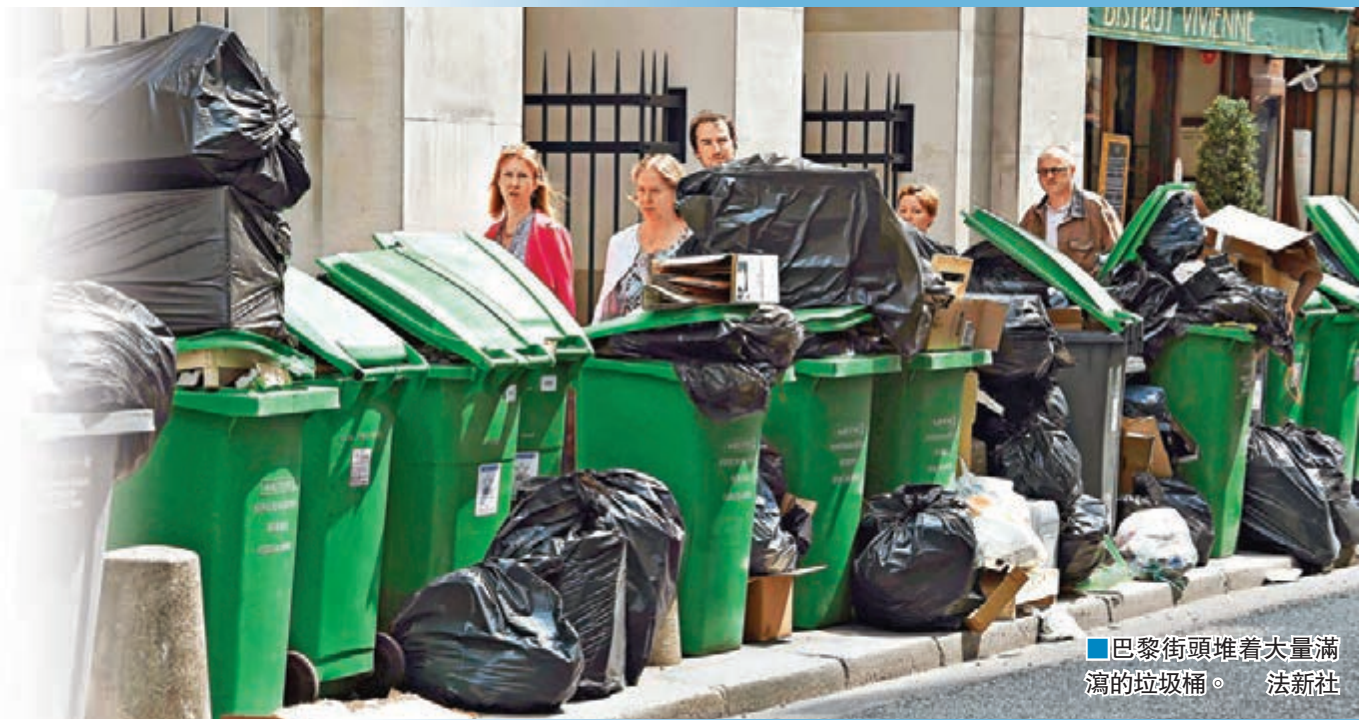
■巴黎街頭堆着大量滿溢的垃圾桶。

四年一度的歐洲國家盃將於香港時間明日凌晨在法國開鑼，但法國政府在排山倒海湧至的難題面前，恐怕難以安心欣賞賽事。除了困擾已久的安全威脅外，因為政府強推勞工法案而觸發的工潮愈演愈烈，各地列車服務持續受阻，首都巴黎、馬賽及聖艾蒂安等賽事舉行城市，均因為清潔工罷工，多處出現「垃圾山」，運載歐國盃冠軍獎盃的列車更遭到示威者擋路。隨着航空業計劃明天起加入罷工，預料圍繞法國及歐國盃的混亂情況會繼續惡化。