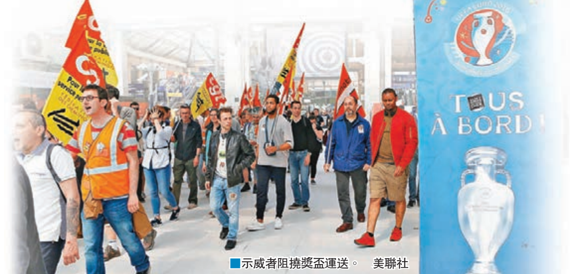
■示威者阻撓獎盃運送。