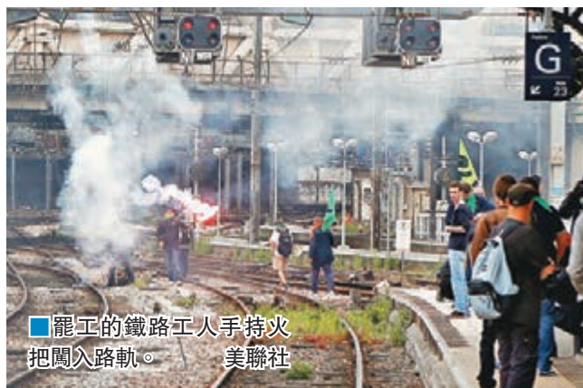
■罷工的鐵路工人手執火把闖入路軌。