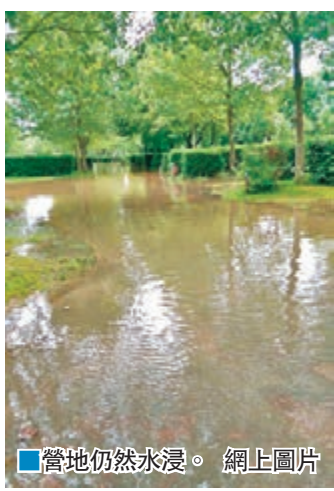
■營地仍然水浸。