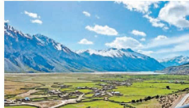
靜謐嫵媚——然烏湖 初夏的然烏湖畔風光。