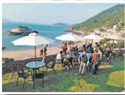
■民宿「愛情海」充滿歐陸風情