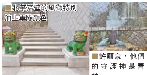
■北竿芹壁的風獅特別 油上軍隊顏色