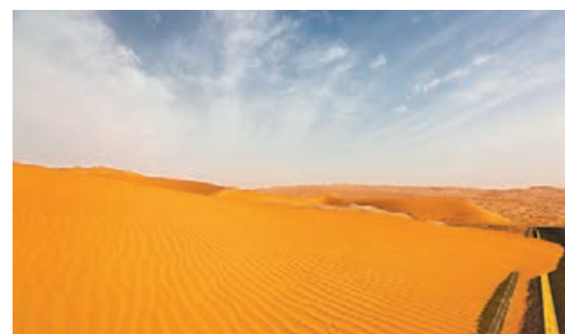
大漠連天沙如雪——阿聯酋利瓦沙漠 阿聯酋的利瓦沙漠，擁有連綿起伏的壯美沙丘。