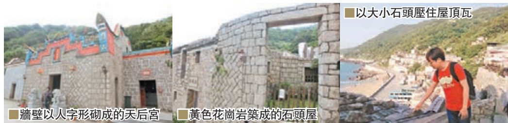
■以大小石頭壓住屋頂瓦