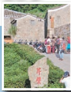
■芹壁號稱「馬祖地中海」