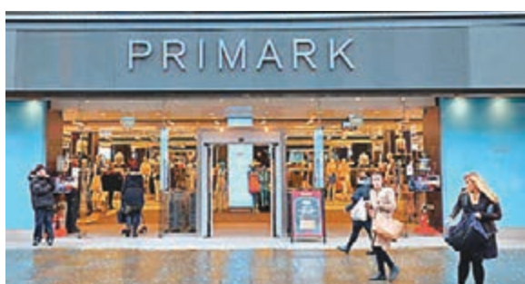
2歲女童當日在Primark時裝店被拐。網上圖片

英國兩名分別13歲和14歲的白人少女，前日承認4月在紐卡斯爾一間商店，綁架一名2歲黑人女童。她們當日亦在同一商店企圖誘拐另一名黑人女童但不果。兩人犯案前曾透過電腦搜索「強姦」、「年輕人被強姦」等字眼，但未有證據證明疑犯有性侵害受害人的意圖。