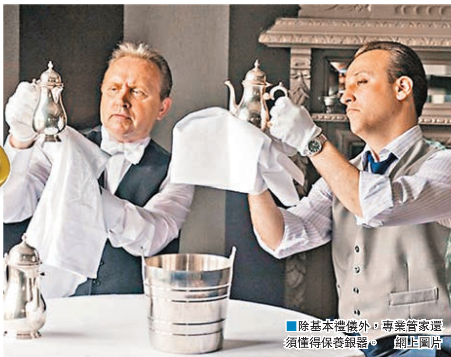
除基本禮儀外，專業管家還須懂得保養銀器。

倫敦大學艾德史密斯學院及紐卡斯爾大學有關現象展開研究，發現家族辦公室這行業加劇英國財富不均，同時鞏固貴族世襲的現象。研究發現，家族辦公室主要協助富豪建立家族王朝，例如會制訂家族規則，要求家族成員定期出席聯誼活動，拉緊親屬關係，並要求成員簽署協議，保護家族財產。換句話說，家族辦公室不但為後代管理財產，更會為家族財產預備繼承人。《21世紀的社會階級》作者、倫敦政治經濟學院社會學教授薩維奇批評，家族辦公室促進財產世襲，不利社會發展。但約翰斯頓表示，貴族如能透過家族辦公室妥善理財，適當用於投資，長遠而言有利社會經濟發展。