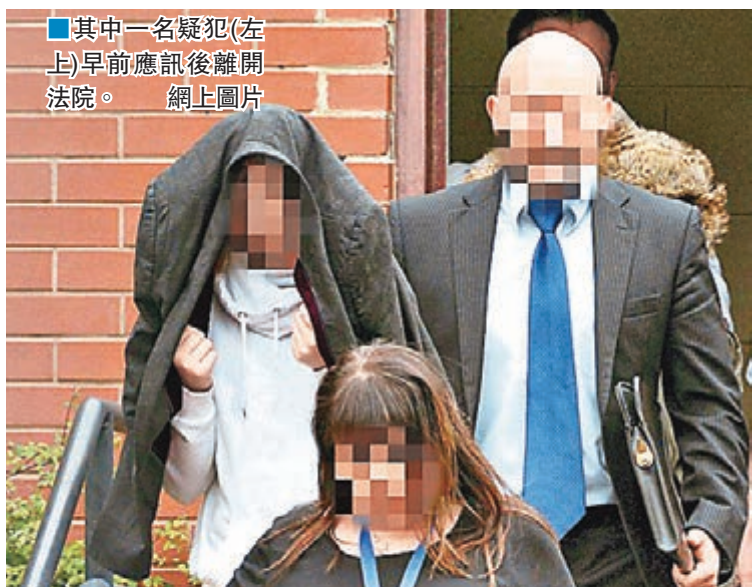
其中一名疑犯(左上)早前應訊後離開法院。

警方當日翻查閉路電視片段，發現兩名少女帶受害人乘坐地鐵到一個公園，在公園內發現受害人，並當場拘捕兩名少女。