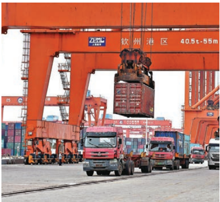
內地5月份進出口增長2.8%。圖為廣西北部灣欽州港區。

香港文匯報訊(記者 馬琳北京報道)內地5月外貿延續反彈勢頭。中國海關昨日發佈數據顯示，5月內地進出口總值2.02萬億元(人民幣，下同)，增長2.8%(同比)。其中，出口1.17萬億元，增長1.2%；進口8,471億元，增長5.1%；貿易順差3,248億元，收窄7.7%。