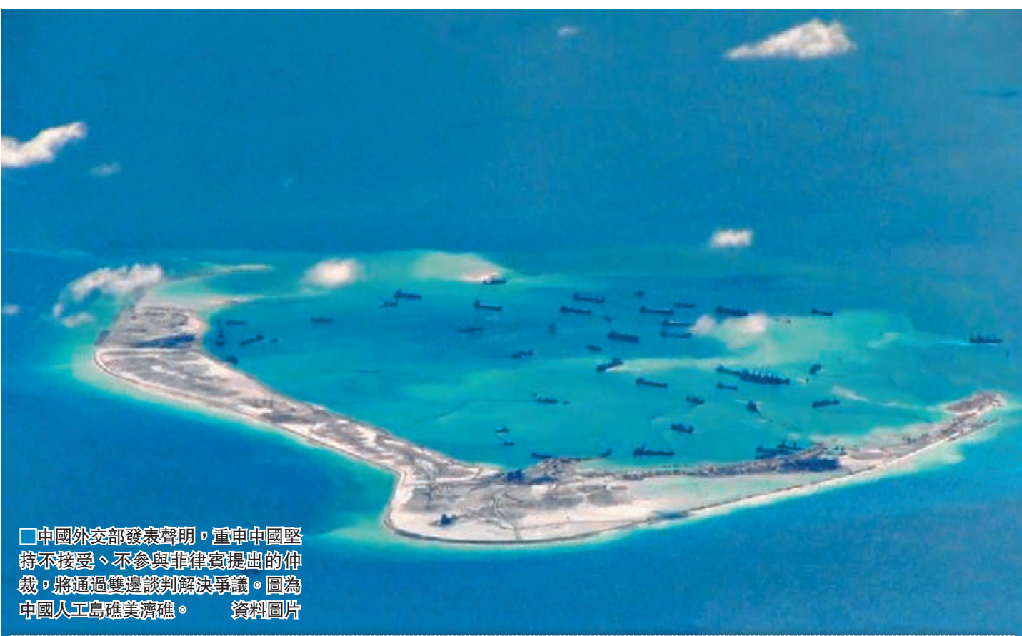
中國外交部發表聲明，重申中國堅持不接受、不參與菲律賓提出的仲裁，將通過雙邊談判解決爭議。圖為中國人工島礁美濟礁。資料圖片

——中國將繼續堅持通過談判解決與菲律賓在南海的有關爭議。在領土主權和海洋劃界問題上，中國不接受任何訴諸第三方的爭端解決方式，不接受任何強加於中國的爭端解決方案。中菲雙邊談判的大門始終是敞開的。中國將繼續堅持在尊重歷史事實基礎上，根據國際法，通過雙邊談判解決與菲律賓在南海的有關爭議。中國敦促菲律賓立刻停止推進仲裁程序的錯誤舉動，回到通過雙邊談判解決中菲在南海的有關爭議的正確道路上來。