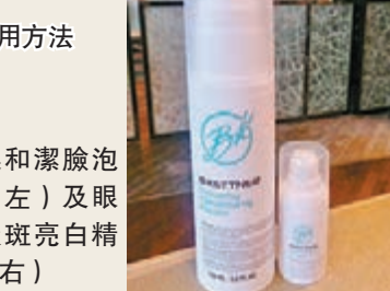
模範兒示範使用方法

用鈦金屬生物相容性塗層，並有過熱保護功能，用家不怕熱能燙傷皮膚之餘，更能夠保護眼部細嫩的肌膚，加上隨機附送採用了德國配方的眼部淡斑亮白精華，使用植物提取的活性精華，添加霍霍巴油，維他命 A，鈣離子分析和特殊配合物，對抗黑眼圈有幫助。