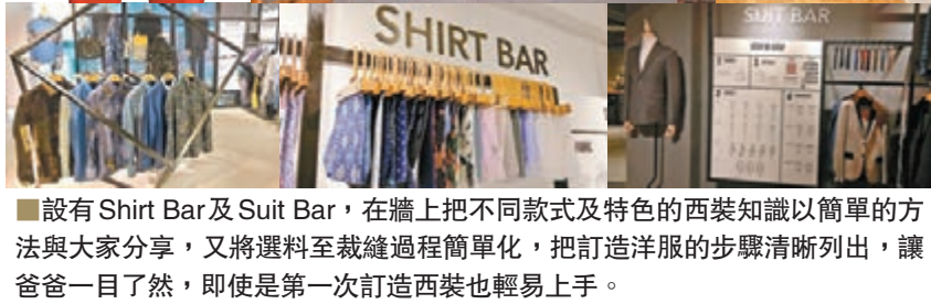
設有 Shirt Bar 及 Suit Bar，在牆上把不同款式及特色的西裝知識以簡單的方法與大家分享，又將選料至裁縫過程簡單化，把訂造西裝的步驟清晰列出，讓爸爸一目了然，即使是第一次訂造西裝也輕易上手。