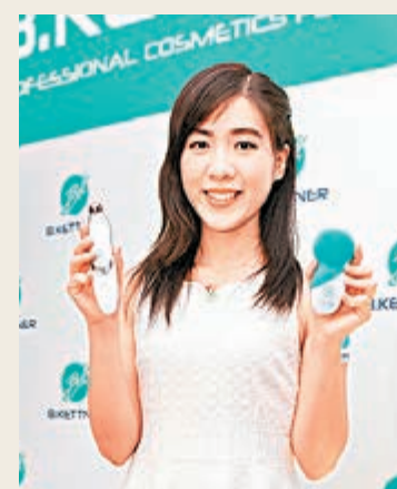
模特兒手持（左）VisoRelax (HK$690) 及 VisoVibe (HK$580)。

用鈦金屬生物相容性塗層，並有過熱保護功能，用家不怕熱能燙傷皮膚之餘，更能夠保護眼部細嫩的肌膚，加上隨機附送採用了德國配方的眼部淡斑亮白精華，使用植物提取的活性精華，添加霍霍巴油，維他命 A，鈣離子分析和特殊配合物，對抗黑眼圈有幫助。