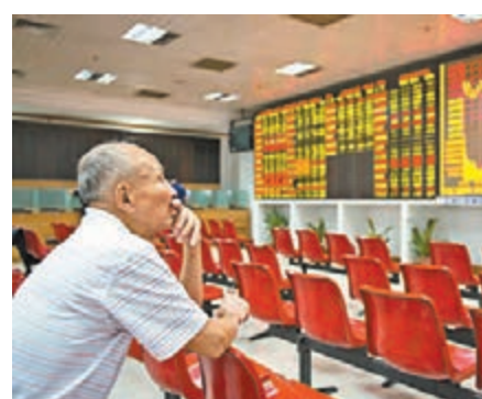
■滬綜指昨收報2,934點。中新社

受美聯儲加息預期降溫影響，黃金概念強勢，山東黃金漲逾7%、湖南黃金漲逾6%，赤峰黃金、中金黃金漲逾4%。近期《汽車動力電池行業規範條件》