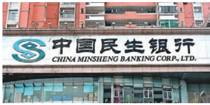
中國銀行上海市分行通過該系統，向民生銀行分行發起一筆FTE賬戶到普通賬戶的首筆支付業務。

香港文匯報訊（記者 章蘿蘭 上海報導）人民銀行上海總部昨日宣佈，上海支付結算綜合業務系統自貿區業務正式上線運行，這是人行上海總部支持上海自貿區建設，服務實體經濟、服務貿易與投資便利做出的一次重要創新與嘗試。上線當日，中國銀行上海市分行通過該系統，向民生銀行上海分行發起一筆FTE賬戶到普通賬戶的首筆支付業務。