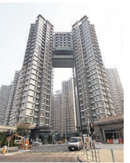
元朗尚悅低層C室最新錄得9,210元成交呎價。

另一方面，荃灣縉庭山一個開放式單位，獲投資客以約293萬元承接，創屋苑逾2年半新低。美聯物業徐偉業表示，單位為1座低層C室單位，面積219呎，是次成交呎價為13,379元。買家為投資客，早前未能於一手市場購得心頭好，故轉戰二手，見上址價格合適，加上預期租金回報近4厘，故拍板入市。原業主於2013年1月以約253萬元購入物業，是次轉售賬面獲利16%。