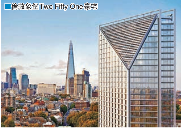
倫敦象堡Two Fifty One豪宅

英國將於23日舉行脫歐公投，由於投資者均觀望投票結果，英國商用物業成交量在今年首季大減四成。有見及此，不少業主在出售商用物業時，都會自願或應買方要求，在合約中加入所謂「脫歐條款」，一旦英國脫歐，買家有權終止交易(踢契)、重新議價，甚至即時減價。有地產代理指，不僅商用物業，有新開售豪宅的發展商，也自願提供「脫歐退款保障承諾」。