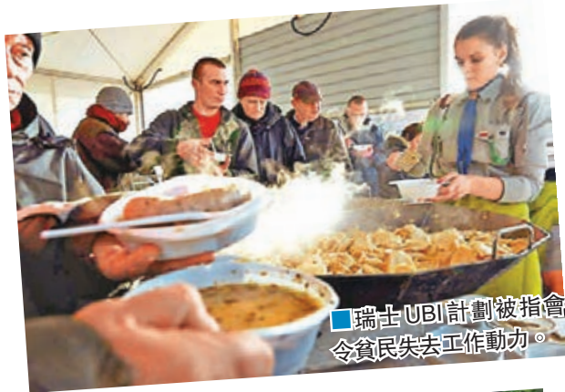
瑞士UBI計劃被指會令貧民失去工作動力。

荷蘭烏特勒支的試驗計劃則把受助人分成4類，並各自賦予做義工等不同條款，以便測試成效。加拿大安大略省的計劃則暫未公佈細節。 ■《衛報》/《獨立報》/《華爾街日報》