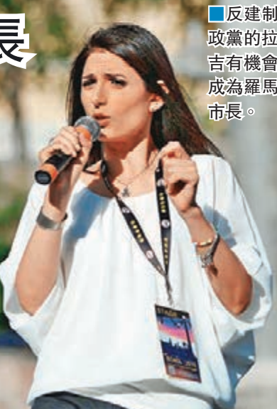
反建制政黨的拉吉有機會成為羅馬市長。

民意調查顯示，民主黨候選人僅在都靈有明顯優勢。米蘭選情難分難解，獲倫齊支持的米蘭世博主席薩拉原本領先，但被中間偏右陣營支持的候選人後來居上。那不勒斯