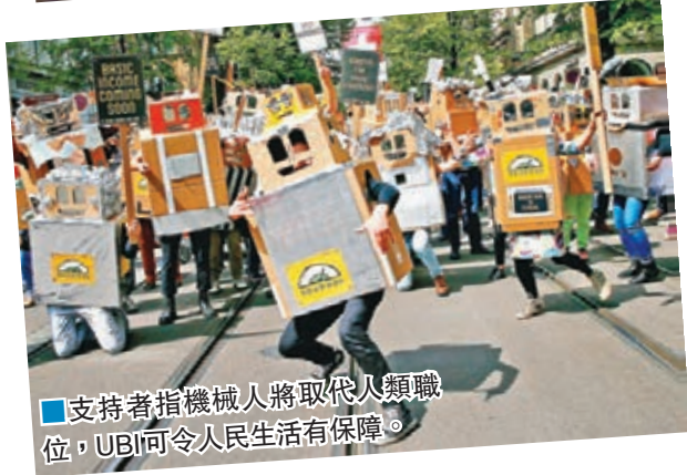
支持者指機械人將取代人類職位，UBI可令人民生活有保障。