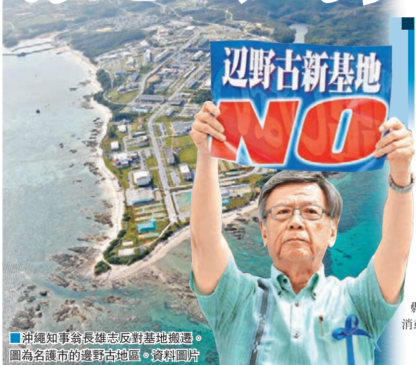
沖繩知事翁長雄志反對基地搬遷。圖為名護市的邊野古地區。

日本沖繩縣議會昨日改選，由於當地上月發生美軍人員涉嫌殺害女子再棄屍的案件，可能造就支持沖繩縣知事翁長雄志、反對美軍基地一派拿下更多議席，令基地縣內搬遷再添變數，美日關係或再起波瀾。翁長一派今後亦可能爭取修訂《駐日美軍地位協定》(SOFA)，改變駐日美軍長久以來享有治外法權的狀況。