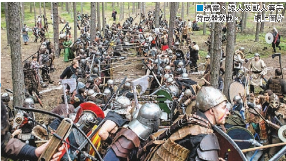
精靈、矮人及獸人等手持武器激戰。