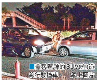
美兵駕駛的SUV(左)逆線行駛撞車。

沖繩早前有女子遭前美國海軍陸戰隊員殺害後棄屍，激發當地反美情緒，駐沖繩美軍上月底宣佈美軍基地宵禁一個月，同時禁止美軍在基地外喝酒。言猶在耳，一名駐沖繩嘉手納基地的美國海軍二等兵前晚因醉駕駕駛，在高速公路逆線行車引發車禍，導致兩名日本男女受傷，其中女傷者胸骨骨折，傷勢嚴重，事件令駐日美軍再受鞭撻。