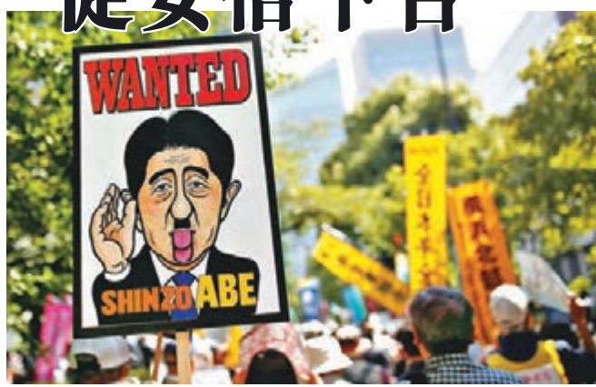
示威者舉牌諷刺安倍是通緝犯。