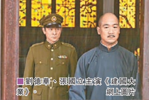
劉德華、張國立主演《建國大業》。