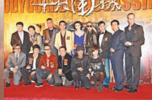
電影《十月圍城》集結多位紅星演出。