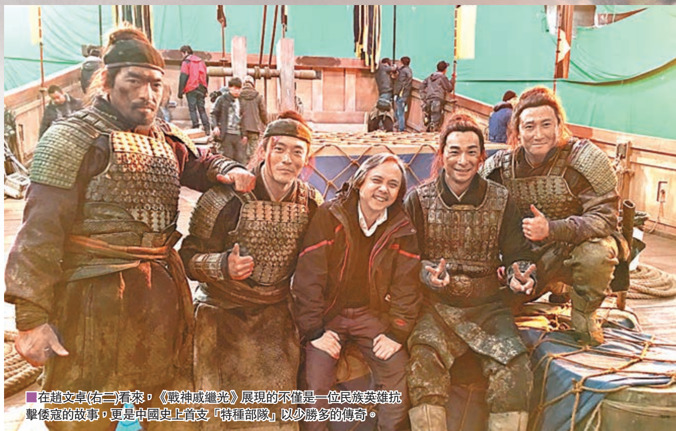
在趙文卓(右二)看來,《戰神威繼光》展現的不僅是一位民族英雄抗擊倭寇的故事,更是中國史上首支「特種部隊」以少勝多的傳奇。

新華社電 打動人心的故事與精益求精的技術結合,大氣磅礴的巨製與陣容豪華的明星疊加,昔日臉譜化、說教式的主旋律電影,如今舊貌換新顏,變得更加「接地氣」,逐漸趟出一條「叫好又叫座」的市場化之路。