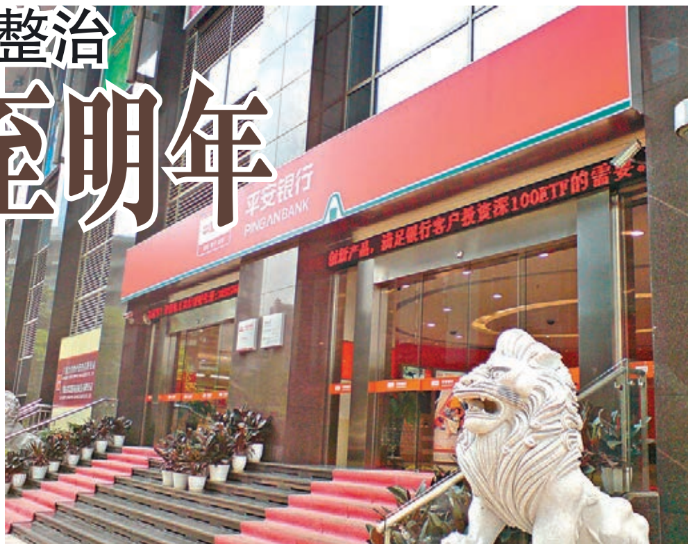
平安銀行旗下陸金所,暫緩原定今年下半年啓動的IPO計劃。

業內認為,從網貸行業收益率和新增平台雙雙走低來看,整體行業依然處在洗牌格局,市場上不斷會有不合格平台退出。雖然長期來看有利行業發展,但短期內洗牌效應造成的波動或會影響正常運作的平台,因此陸金所選擇等待風波過後再進行IPO屬明智之舉。