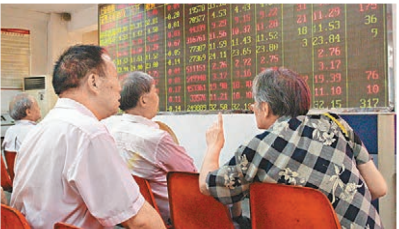
滬綜指昨日收報2,925點,升0.4%。中新社

漸回暖,尾盤加速上行。截至收市,滬綜指報2,925點,漲11點或0.4%;深成指報10,274點,漲64點或0.64%;創業板指報2,188點,漲19點或0.91%。量能較上一交易日萎縮,兩市共成交5,605億元(人民幣,下同),其中滬市成交1,850億元,深市成交3,754億元。當日滬股通淨流入12億元,這是滬股通連續第14個交易日淨流入,不過淨流入量較前日減少。