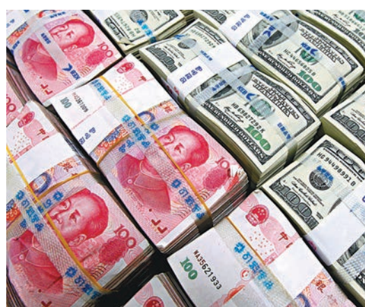
人民幣兌美元中間價昨日大幅反彈。資料圖片

香港文匯報訊 人民幣兌美元中間價昨日大幅反彈,報6.5688,較上日大升201點子或0.31%;即期收盤也放量微升,收報6.5792,較上日升29點子或0.04%。交易員稱,6.58元附近多空分歧明顯,市場成交明顯放大;美元指數回調給人民幣多頭喘息機會,但周五美國將公佈非農就業數據,人民幣料仍承壓。