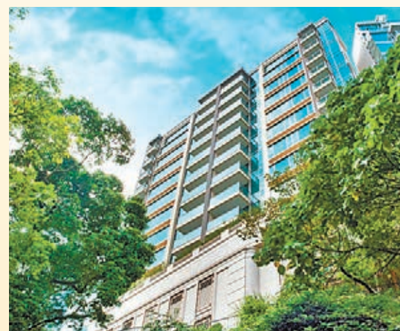
信和置業有限公司 Cluny Park