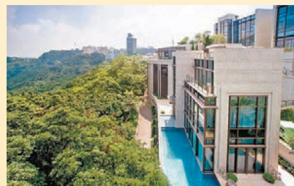
新鴻基地產發展有限公司 Twelve Peak