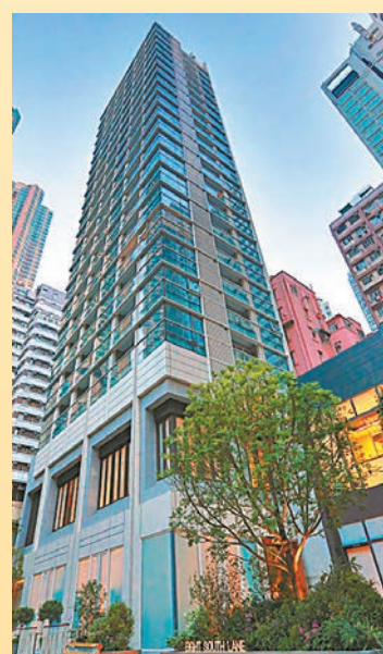
新世界發展有限公司 Eight South Lane