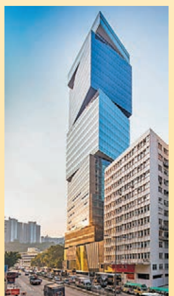
恒基兆業地產有限公司 Global Trade Square