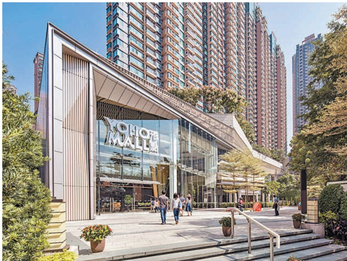
創智建築師有限公司 YOHO MALL

寶利建築顧問有限公司 (BCI Asia) 將於今晚假香港君悅酒店舉行第十二屆「BCI Asia Awards」年度頒獎典禮，以表揚香港十大最活躍的建築設計公司及地產發展商。FuturArc「環保建築設計大獎」及「環保設計先鋒大獎」亦將於典禮上公佈獲獎名單並頒獎。屆時，本港建築及地產界一眾精英將再次齊聚一堂，共同見證這歷史性的一刻。