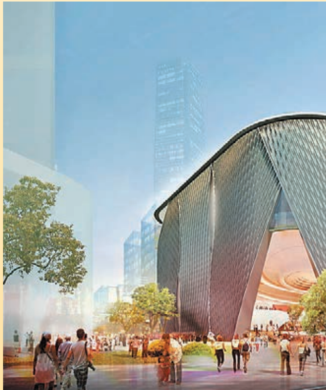
呂元祥建築師事務所 Xiqu Centre (in collaboration with Bing Thom Architects)