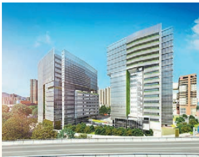
李景勳、雷煥庭建築師有限公司 West Kowloon Government Offices in Yau Ma Tei