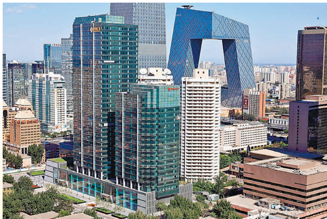
中國海外發展有限公司 China Overseas Plaza, Beijing

「環保建築設計大獎」為亞洲最具影響力的綠色建築設計獎項之一，旨在鼓勵推動亞洲地區帶來前衛、創新的建築設計概念。本年度以「小事物 大改變」為主題，共有 6 個大獎及 9 個優異獎。香港學生 Chung Wai Kin 憑藉其「另類綠化城市概念：於香港進行零規劃種植」項目贏得學生組別第三名。他頭冠鼓勵香港人口稠密的社區參與，探索「由下而上」綠化實踐的可行性。