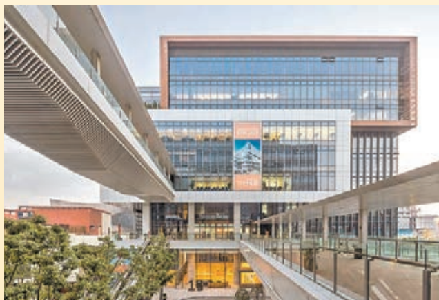
巴馬丹拿建築及工程師有限公司 The Hub, Shanghai