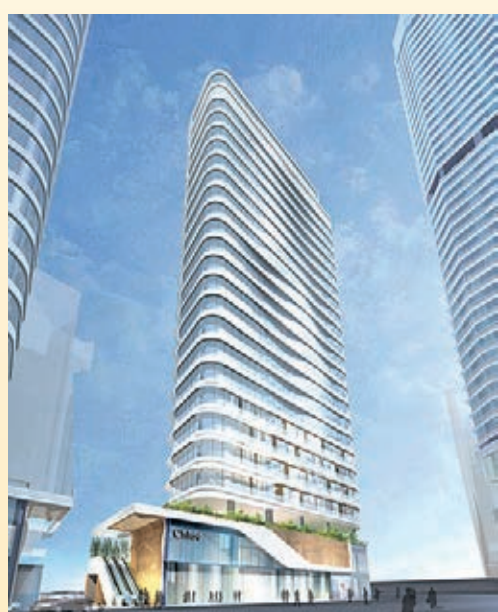
劉榮廣伍振民建築師事務所(香港)有限公司 North Point Office Redevelopment