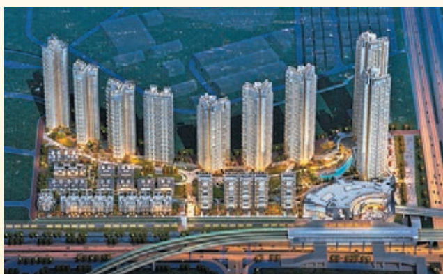
梁黃頤建築師(香港)事務所有限公司 MTR · Tiara, Shenzhen