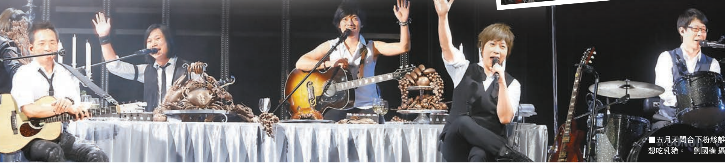
台上台下打成一片。

每場出現的「豐盛的晚餐」環節上，今次有別於過去9晚，桌上竟然放上真食物：一隻乳豬，阿信便問台下粉絲「誰想吃?」，全場幾乎都舉手，阿信傻笑道：「只是小豬，萬多人不夠分。」隨即便叫工作人員拿回後台分配。