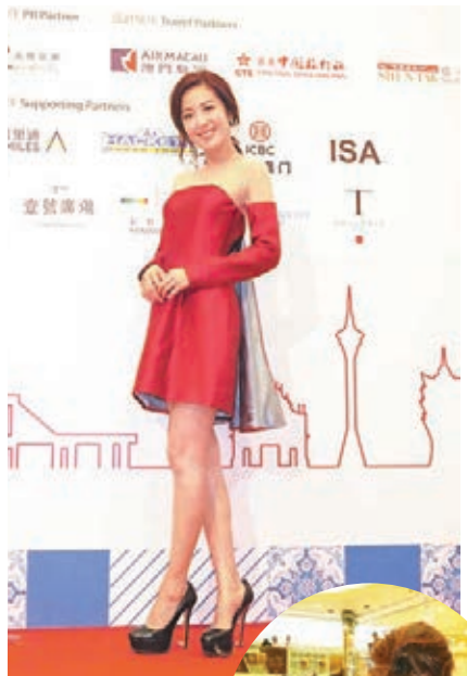
唐詩詠稱從來不會管另一半。

再問到她經過這次是否百分百信任男友?詩詠稍作猶疑才答：「大家唔使咁多揣測，唔使咁嚴重。」之前她被拍到與男友在銅鑼灣鬧交，問到是為了什麼事?詩詠否認兩人在鬧交：「只係自己唔笑就似黑口黑面，加上當日有啲受驚，無認過有咁多記者