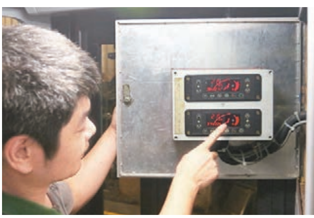
■冷氣電車可調校至不同溫度。