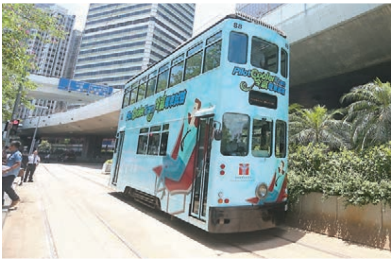
■冷氣電車車身以天藍色設計，給予乘客涼快的感覺。