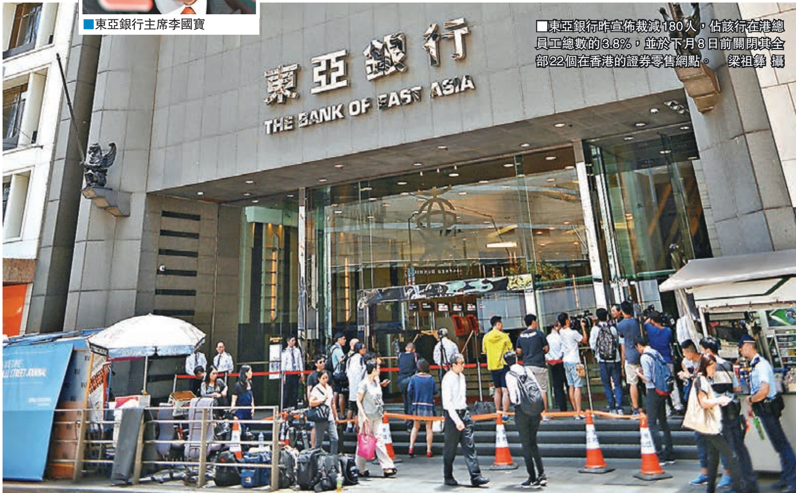
東亞銀行昨宣佈裁減180人,佔該行在港總員工總數的3.8%,並於下月8日前關閉其全部22個在香港的證券零售網點。

東亞銀行昨早宣佈裁員180人,佔該行在香港總員工人數的3.8%,受影響的員工一般可獲優於香港僱傭條例規定的遣散費。旗下東亞證券並於7月8日前關閉其全部22個在香港的證券零售網點,但將繼續透過電話及其他電子渠道,包括互聯網、手機應用程式及電話服務等,繼續為客戶提供證券買賣服務。