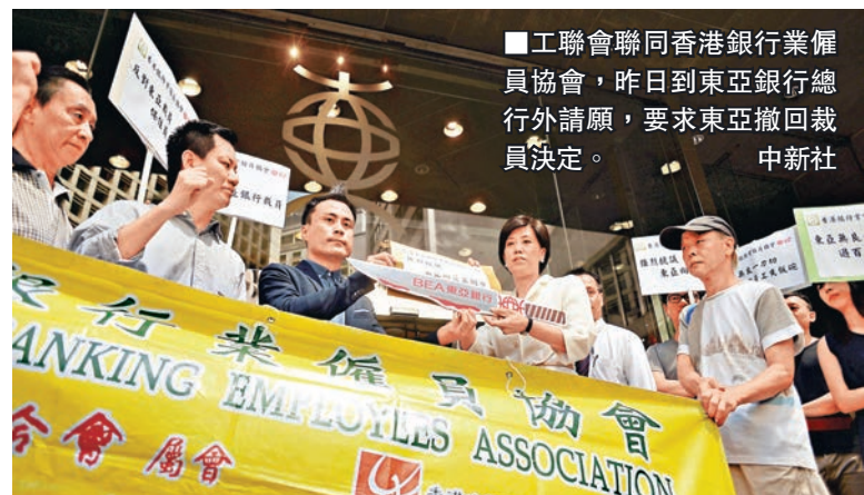
工聯會聯同香港銀行業僱員協會,昨日到東亞銀行總行外請願,要求東亞撤回裁員決定。