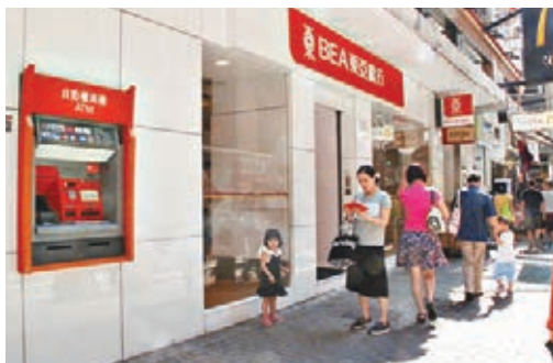
銀行經營成本重,加上證券行減佣搶客,令銀行證券業務難以維持。

該行主席李國寶在給員工的信中提到,經過近期一輪較全面的檢視後,決定取消多個不合時宜或重疊的程序和架構,並把資源調配至更高增值的範疇。希望重整業務可以應對當前極具挑戰的經營環境,管理層未來會以更具問責性的方向發展,以實現發展業務和節省成本目標。