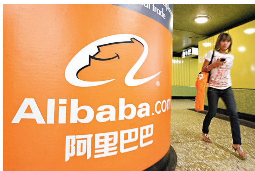
軟銀將出售至少價值79億美元的阿里巴巴集團股票。資料圖片

元,跌2.52%。各種跡象顯示,隨着中國內地經濟增長放緩 and 美國加息預期升溫,外資對「互聯網+」概念企業的熱情正在迅速冷卻。彭博5月底公佈的數據披露,第一季度對沖基金合計減持了27億美元在美上市中資股票,減持幅度約為12%。在按市值計前20大公司中,10隻遭減持最多的股票全部為互聯網相關企業,對沖基金對這10隻股票的合計減持幅度超過25%。