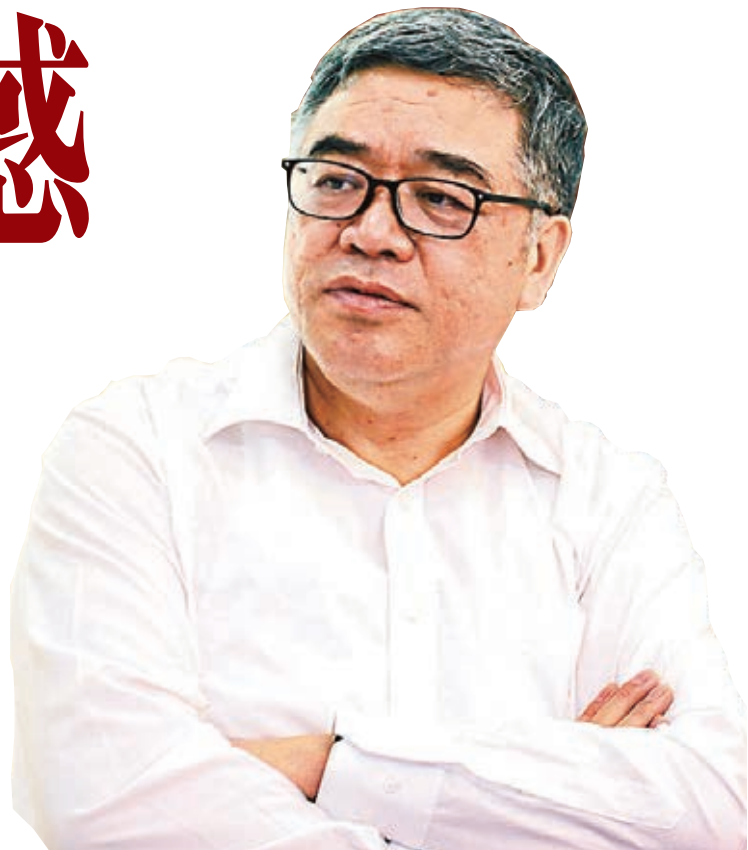
■民進中央副主席、全國政協副秘書長朱永新。

對於時間上的努力，朱永新是這樣形容的：「如果每天比別人多工作2小時，一年就多了730小時，50年就多了36,500小時，也就是多了整整1,520天，差不多延長了4年的生命！這是每一分鐘都有效的生命。」如果按照每天8小時的工作時間，就多了整整12年！