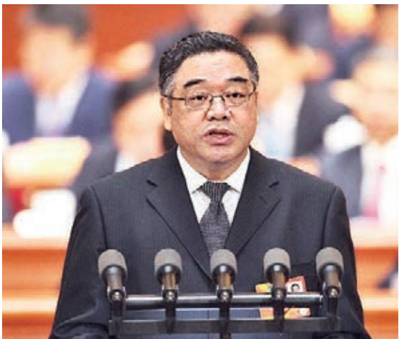
■朱永新在全國政協十二屆一次會議第三次全體會上發言。

今年，是朱永新呼籲設立「國家閱讀節」的第14年。縱觀他歷年兩會提案，90%是圍繞「教育」、「閱讀」兩大主題。教育和文化領域，是他精心耕耘了大半輩子的田地。