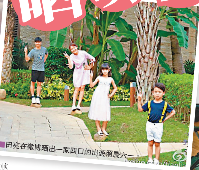
田亮在微博晒出一家四口的出遊照慶六一。