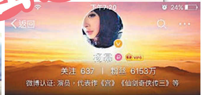
楊冪來港8小時陪寶貝女小糯米慶祝兩歲生日。