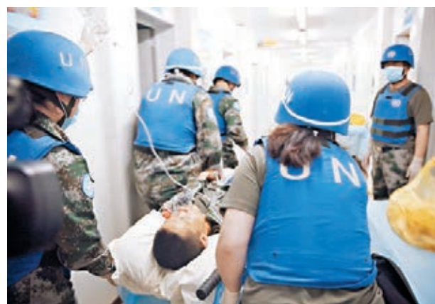
中國駐馬里大使館昨日證實，1名中國維和人員5月31日晚在聯合國維和人員營區遇襲事件中犧牲，另有4人受傷。圖為傷者。

馬里2012年發生軍事政變。聯合國安理會2013年通過決議，決定設立馬里穩定團。雖然馬里政府與北部地區部分武裝組織簽署《和平與和解協議》，但馬里北部地區近年來一直衝突不斷，安全局勢嚴峻。中國駐馬里大使館昨日提醒中國公民密切關注當地局勢發展，近期謹慎前往馬里，切勿前往馬里中北部地區。提醒在馬中國公民和機構繼續保持高度警惕，加強安全防範和應急準備。