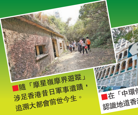
隨「摩星嶺摩界遊蹤」涉足香港昔日軍事遺蹟,追溯大都會前世今生。