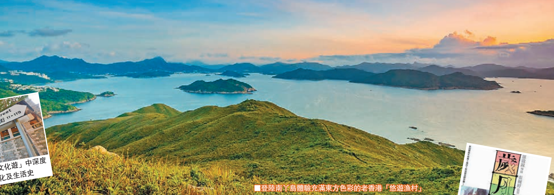
登陸南丫島體驗充滿東方色彩的老香港「悠遊漁村」