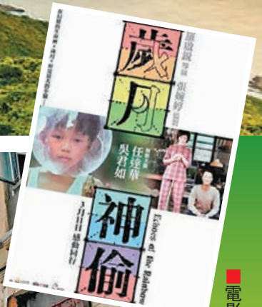
電影《歲月神偷》海報