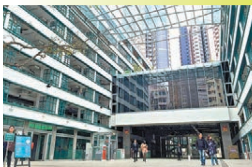
PMQ元創方,前身為荷李活道已婚警員宿舍。

此外,他表示透過旅發局「新旅遊產品發展及經費資助計劃」的支持,香港中小型旅遊公司可以大膽地開發創意旅遊產品,並且能通過旅發局的宣傳平台,令更多遊客認識這些新的旅遊體驗。