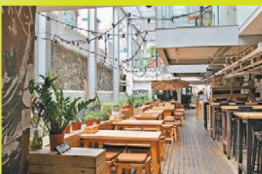
漫遊途中,可在PMQ元創方喝杯咖啡,小憩片刻。