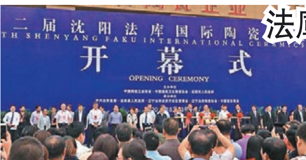
日前舉行的第十二屆瀋陽法庫國際陶瓷博覽交易會上，「大青到大連海鐵聯運」運輸線開通。

香港文匯報訊(記者 于加琳 瀋陽法庫報道)日前開幕的第十二屆瀋陽法庫國際陶瓷博覽交易會期間，「大青到大連海鐵聯運」運輸線的開通實現了法庫陶瓷以快速、便捷、低成本的運輸方式公平參與產區競爭，破解發展瓶頸。