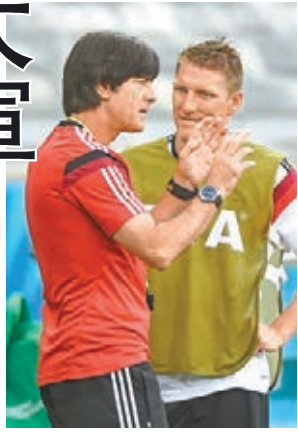
■舒韋恩史迪加(右)首次擔任路維(左)的德足國際大賽名單的正隊長。資料圖片