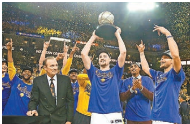
■基利湯遜(舉盃者)和史提芬居里(右)等勇士球星，慶祝再度奪得NBA西岸冠軍。