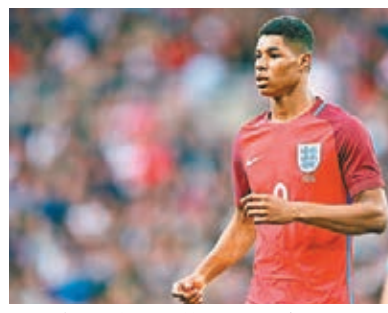
■拉舒福特將隨英足征戰歐國盃。