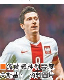
波蘭戰神利雲度夫斯基。資料圖片

波蘭國足曾於2008年及2012年出戰歐國盃決賽周，兩次俱小組賽止步。然而他們卻是鄰邦德國隊今屆歐國盃爭C組首名出線的最強勁敵，兩隊今屆歐國盃分組賽亦是同組，德足首循環作客曾以0:2不敵波蘭，波蘭次循環作客則以1:3遭德國隊成功復仇。波蘭主帥拿華卡已公佈了23人名單，2015/16球季以30個入球勇奪德甲神射手獎並協助拜仁慕尼黑成就德甲及德國盃雙料冠軍的27歲波蘭戰神利雲度夫斯基，門前把握力極強，且搶點能力高，將成各大勁旅的心腹大患。