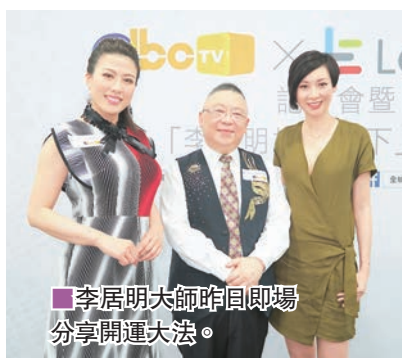
李居明大師昨日即場分享開運大法。

香港文匯報訊(記者李思穎)為慶祝DBC數碼電台旗下的電視頻道登陸樂視,DBC昨日特地在北角新光戲院大劇場舉行記者會,《李居明妙論天下》節目主持李居明大師、江美儀更即場與一千名粉絲見面,分享開運大法,李居明透露:「《李》節目將以電視形式播出,有感現時電視競爭中,風水師也是被爭奪棋子,就像早前為無綫主持節目《改運王》便獲得22點不錯收視,其後便被邀為DBC主持節目,其實無綫和ViuTV均有接觸再做風水節目,也令我有些尷尬,今次會否怕無綫小器?」唔知呢,但近日都有接洽過。」江美儀跟無綫有藝員合約至2018年屆