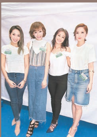
Super Girl昨日仍然不齊人現身。