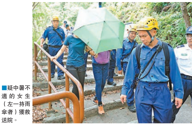
疑中暑不適的女生（左一持雨傘者）獲救送院。