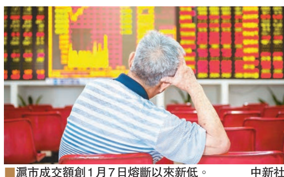
滬市成交額創1月7日熔斷以來新低。

另有分析人士指出，上周五上交所、深交所就「上市公司籌劃重大事項停復牌業務」發佈指引，海外多家機構因此調高其對A股納入MSCI新興市場指數的預測。