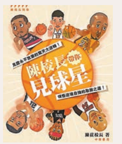
《陳校長帶你見球星》 作者：陳莊

簡介：球星們最光輝的時刻，就是不畏懼不退縮的那一刻。高比拜仁受到同學排擠與嘲笑，他選擇苦練球技以捍衛尊嚴；年少的艾佛遜坐了四個月冤獄，他選擇以拚命的鬥志拿下聯盟 MVP；初出茅廬的奴域斯基被球迷取笑弱不禁風，他選擇魔鬼式訓練以一雪前恥……書中十二位NBA球星的故事，都是接受逆境挑戰的真實人生。要是選擇放棄，他們的比賽就結束了。因為沒有放棄，他們終於締造一場又一場的反敗為勝。