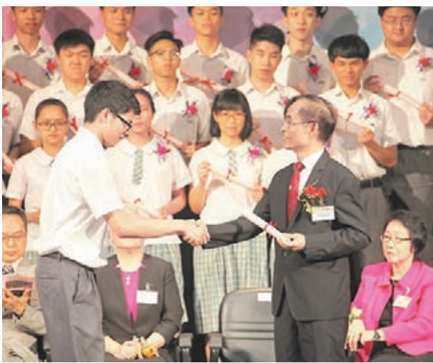
勞校日前舉行畢業禮，主禮嘉賓余濟美向畢業生頒發證書及獎項。

此外，該校又設雙班主任制，推行家訪活動，並透過家長義工，家校合作輔導學生成長，學校又大力推動閱讀風氣，並推廣體藝活動，以提升學生整體個人素質。