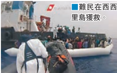
難民在西西里島獲救。

雖然歐洲各國已採取應對措施，但地中海難民潮依然禁之不絕，屬於意大利等歐洲國家的船隻，單是前日便在西西里島以南海域救起668名難民，令過去一星期從海中救起的人數增加至1.3萬人。聯合國難民署則表示，過去幾日估計有超過700名難民葬身地中海。意大利海軍及海岸防衛隊是在聯同愛爾蘭及德國船隻進行巡邏任務時，救起該批難民。由於西西里島難民營人滿為患，當局安排部分難民轉送意大利南部港口雷焦卡拉布里亞，預計昨日抵達。