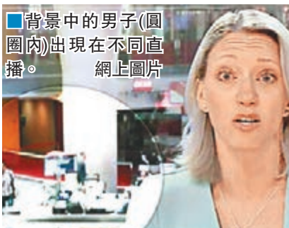
背景中的男子(圖圈內)出現在不同直播。

英國廣播公司(BBC)早晨新聞直播有「疊惑」，有眼利觀眾發現，不同主播在不同日子主持節目期間，背後佈景板都有同一人穿相同服飾走過。BBC承認節目是在錄影室內進行，佈景板內容是預先錄製。BBC發言人稱，預先錄製佈景板的做法很普遍，又稱「即時」是指節目訪問內容本身，並非佈景板。