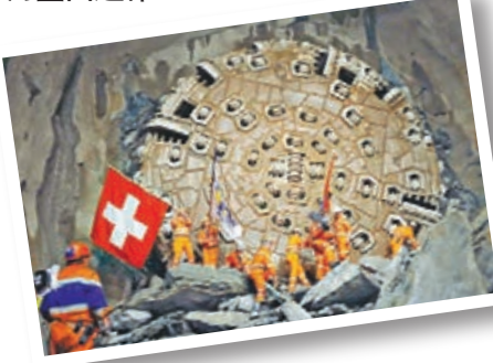
工人於2010年慶祝打通隧道。