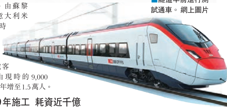
隧道早前進行測試通車。

通車後，由蘇黎世至意大利米蘭只需2小時40分鐘，較現時快近1小時。每日載客量亦可由現時的9,000人，到2020年增至1.5萬人。