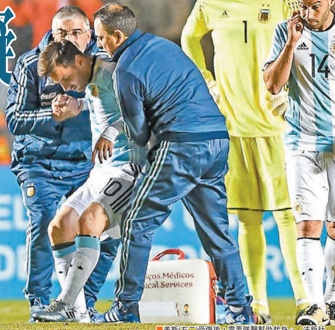
美斯(左二)受傷後，需要隊醫幫助起身。

這場熱身賽阿根廷佔據絕對優勢，但僅由希古恩在第31分鐘攻入一球，而美斯的受傷顯然更引人關注。第59分鐘時，美斯在爭搶空中球時被對手兇猛地撞了一下，此後美斯露出痛苦表情，並捂住其後背的下部，在隊醫臨場處理了幾分鐘後，美斯還是被換下，隨後送往私人醫院接受更詳細的檢查。