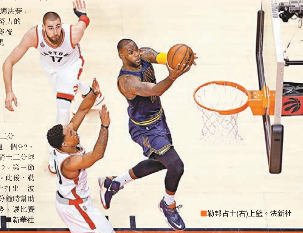
勒邦占士(右)上籃。