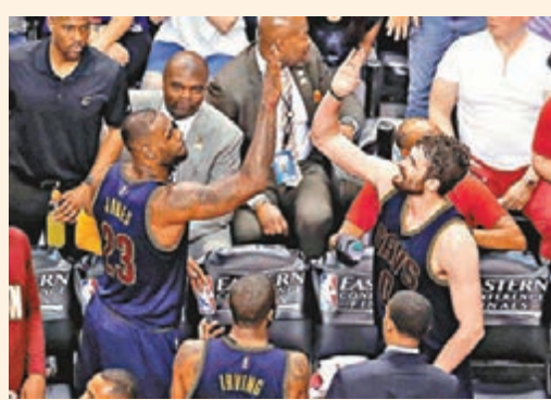
勒邦占士(左)與路夫擊掌慶祝。