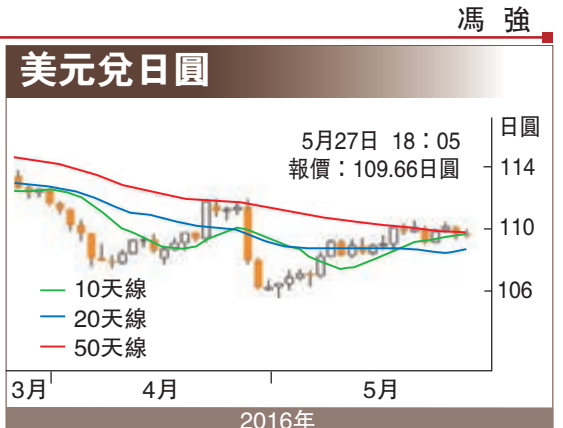
5月27日 18:05 報價：109.66日圓