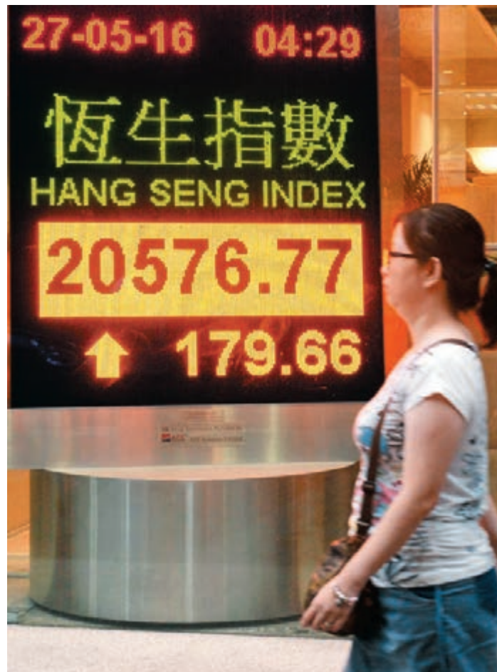
恒指昨升179點, 全周計, 恒指累升724點或3.7%。